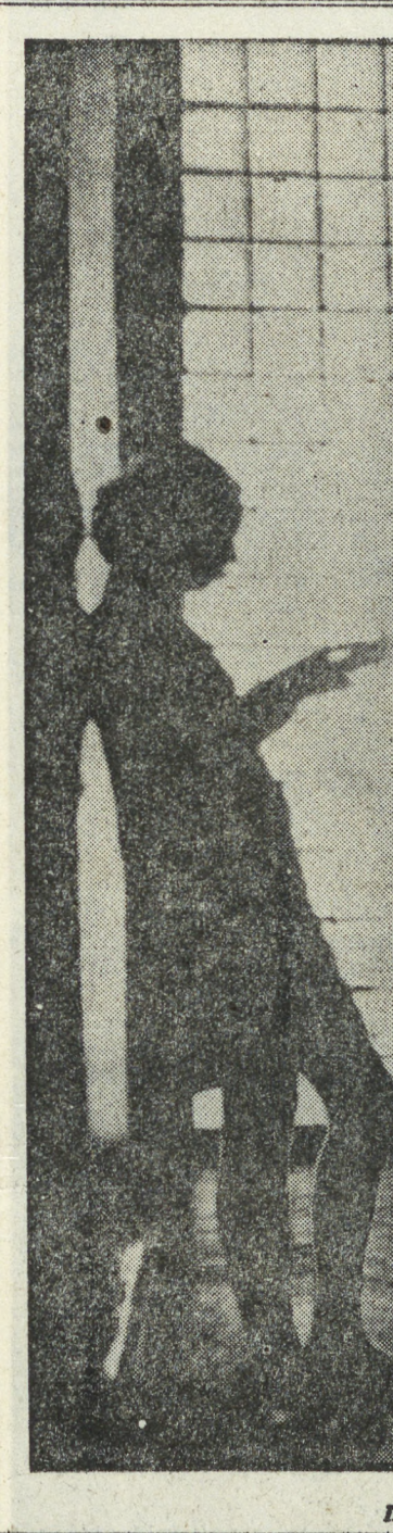
Перед экзаменом.

— В КАКОЙ язык изучаете? — Немецкий? На каком курсе учитесь? Не смогли бы вы ответить на некоторые вопросы преподавателя из ГДР?