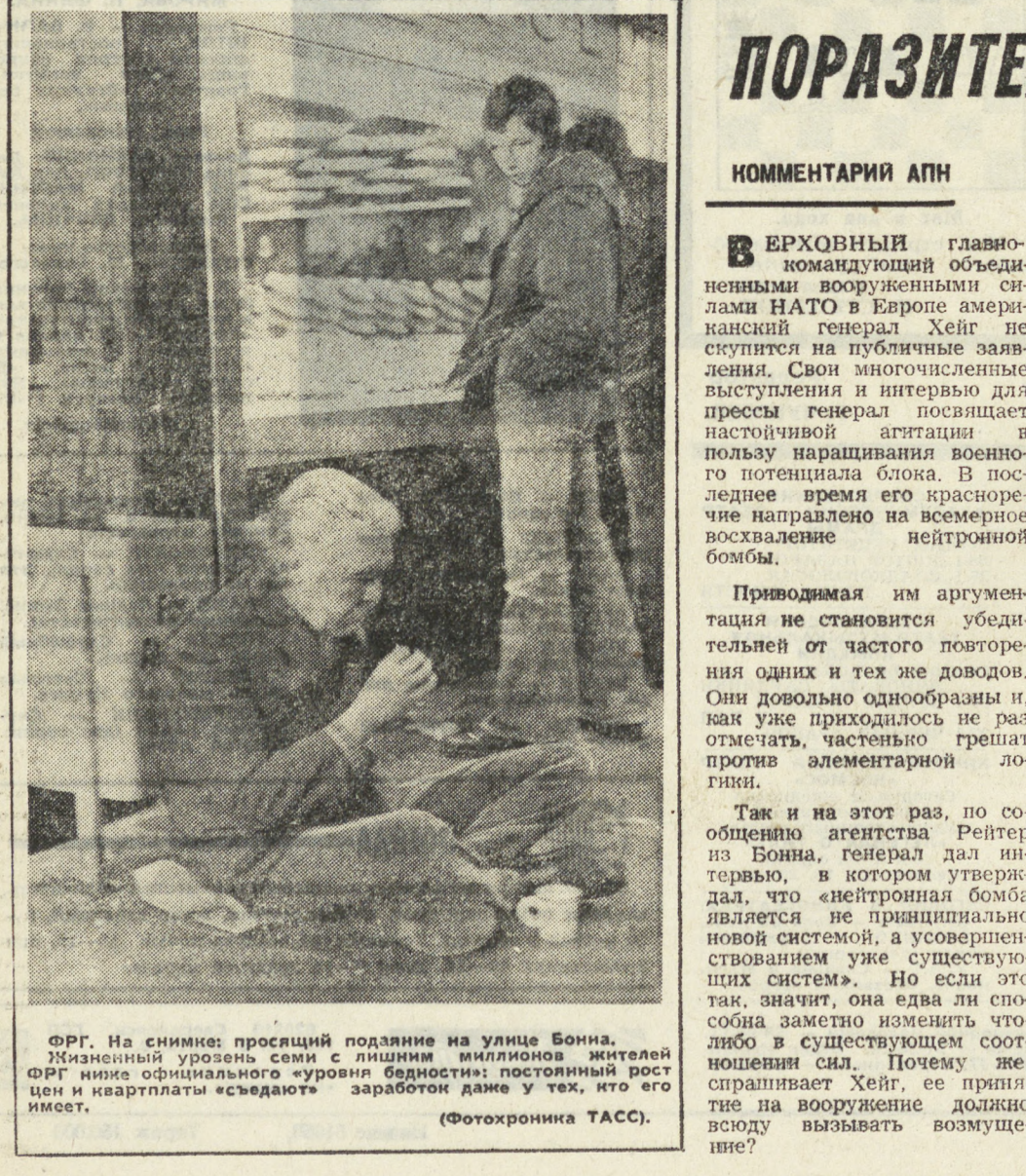
ФРГ. На снимке: проспичный подвиг на улице Бонна. Ужасный урон семи с лишним миллионам жителей ФРГ нанес официальное «уровня бедности» постановление о снижении цен и квартплата «сдадут» заработок даме у тех, кто его имеет.