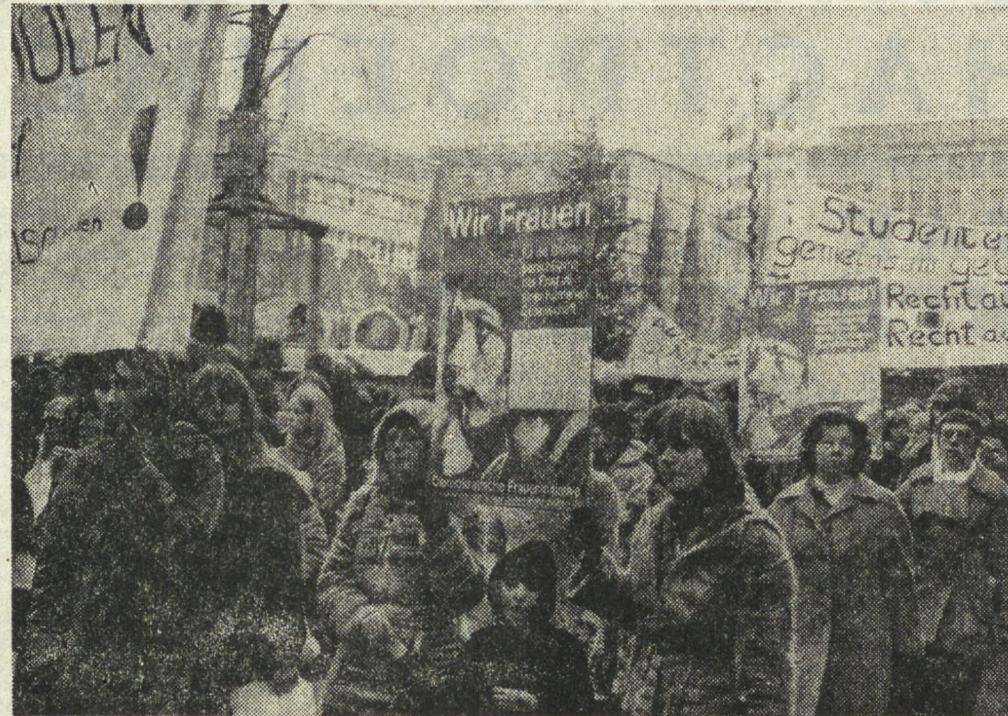
ЭСССН. Мощная манифестация за осуществление в ФРГ демократических и социальных прав граждан.

«СПАРТАК» (БАКУ) — «КАЛИНИНЕЦ» Неравными, естественно, были силы в матче дебютантов.