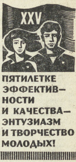
ПЯТИЛЕТКЕ ЭФЕКТИВНОСТИ И КАЧЕСТВА — ЭНТУЗИАЗМ И ТВОРЧЕСТВО МОЛОДЫХ!

В ней В. И. Ленин говорил, что социализм не только не угасает соревнование, а, напротив, впервые создает возможность применить его действительно широко, действительно в массовом размахе, втянуть действительно большинство трудящихся на арену такой работы, где они могут проявить себя, развернуть свои способности, обнаружат таланты, которых в народе — непочатой родни... В этой статье В. И. Ленин подчеркивал: «Чем разнообразнее, тем лучше, тем богаче будет общий опыт, тем вернее и быстрее будет успех социализма, тем легче практика выработает — ибо только практика может выработать — наилучшие приемы и средства борьбы». Статья В. И. Ленина «Как организовать соревнование?» является программным документом для всех, кто организует социалистическое соревнование и кто в нем участвует.