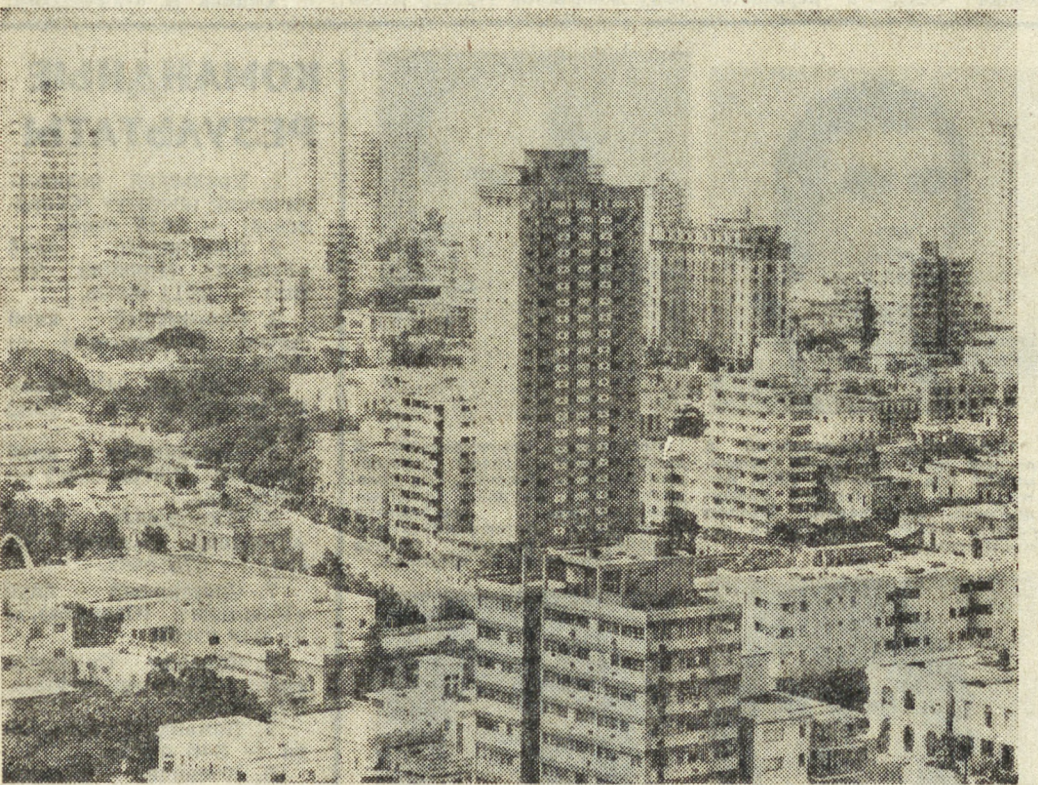
СТОЛИЦА КУБЫ — ГАВАНА.

В юбилейный год своего существования братская Куба вступает решительным и твердым шагом. Уже притихли злобные голоса, которые прорекли невозможность построения социалистического общества на островах свободы. Сегодня успехи Кубы признаны всем миром.