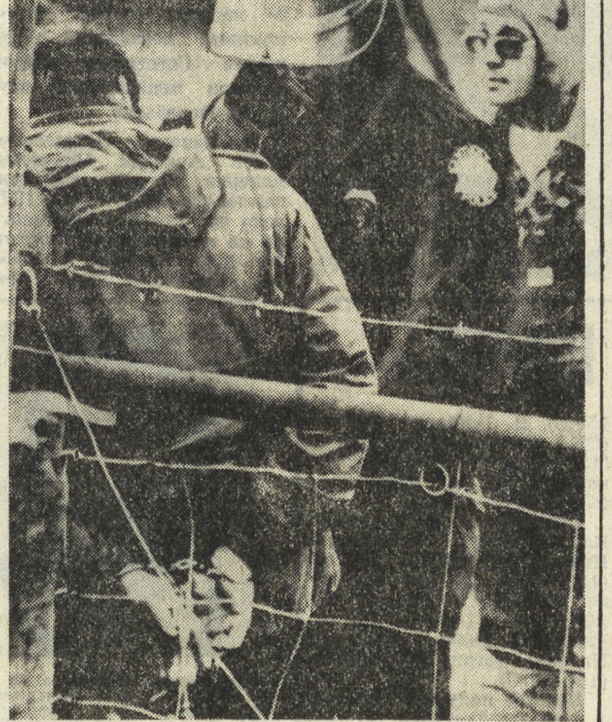
Продолжается забастовка свыше 160 тысяч американских шахтеров. Члены объединенного профсоюза горняков прекратили работу в знак протеста против отказа предпринимателей подписать новое трудовое соглашение, которое включало бы ряд требований шахтеров, в частности, о повышении заработной платы и улучшении условий труда. У многих шахтерских организаций полиция с горняками, участвующими в пикетах. НА СНИМКЕ: полиция производит аресты пикетчиков.

Неверие в будущее расистского режима заставляет белых поселенцев бежать из страны. Только в ноябре Родезию покинуло около 600 человек, а всего за 11 месяцев этого года из страны выехало 11 тысяч человек. (ТАСС, 29 декабря).