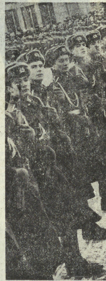
ГЛАВНАЯ площадь Свердловска в праздничном убранстве. К этому событию площадь имени 1905 года надела новый наряд — ленту опоясывают всевозможные флаги и транспаранты, славящих 60-ю годовщину Великого Октября.

Утро 7 ноября 1977 года. На площади выстроены колонны войск Краснознаменного Уральского военного округа, готовых к параду. посвященному 60-летию Великой Октябрьской социалистической революции.