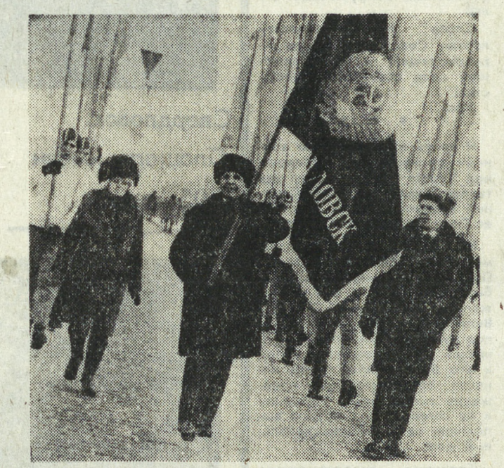
Ветераны Великой Отечественной войны. Это они заставили собой наше Отечество в годы тяжелых испытаний. Образцы героизма показаны на фронтах Великой Отечественной войны. И сегодня мы по праву отдаем должное их героям.

Положение тех, кто держал в руках стяг революции в годы гражданской войны, поколение 30-х годов, когда первые пятилетки продемонстрировали силу и мощь нашей страны, поколение тех, кто отстаивал завоевания революции на фронтах Великой Отечественной войны, и сегодняшнее поколение строителей коммунизма. Всех нас связывает одно — верность ленинским идеям, идеалам Великого Октября.