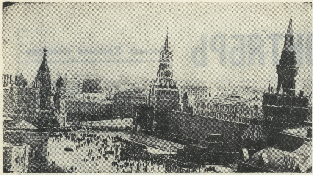
Москва. Красная площадь