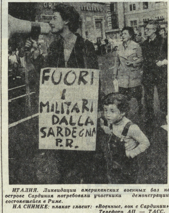
ИТАЛИЯ. Ликвидация американских военных баз на острове Сардиния потребовала участия демонстрантов, состоявшейся в Риме. НА СНИМКЕ: плакат гласит: «Военные, вой с Сардинией».

П. БОГОМОЛОВ, спец. корр. АПН. Печ — Москва.