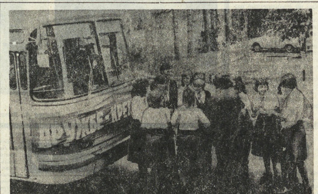
ПОЛЬША. Встреча советской и польской молодежи, посвященная 60-летию Великого Октября. В центре: представительница советской и польской молодежи. На скижке: представители советской и польской молодежи.