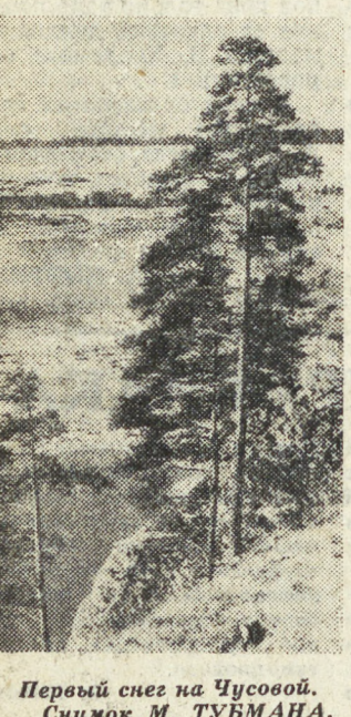
Первый снег на Цусовой.

В Свердловске, в государственной библиотеке им. В. Г. Белинского, открылась выставка «Свердловская книга — 1971-1977», организованная Средне-Уральским книжным издательством, областным отделением общества любителей книги, сотрудниками библиотеки. Она станет своеобразным творческим отчетом книжного издательства перед свердловскими читателями. В дни работы выставки будут проведены дни художественной литературы, военно-патристической, краеведческой и политической литературы, выпущенной к 60-летию Великого Октября. Состо-