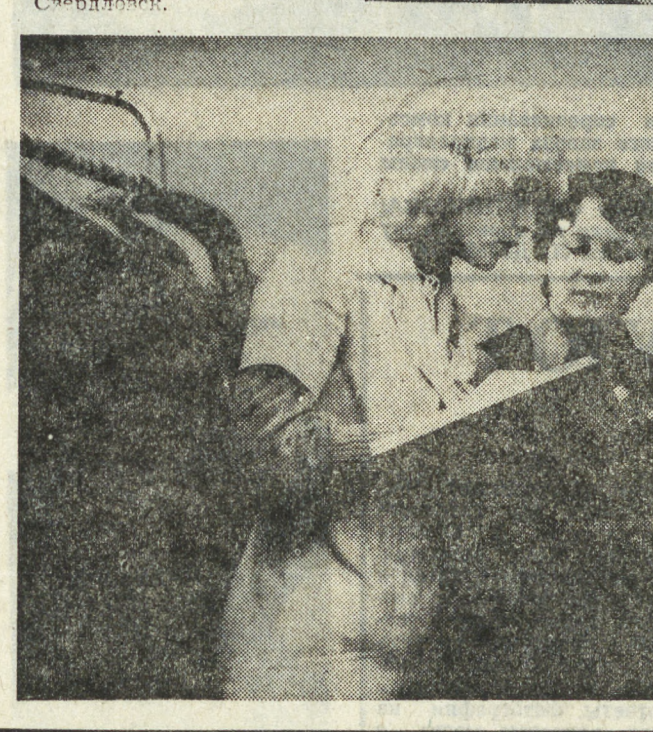
Свердловск.