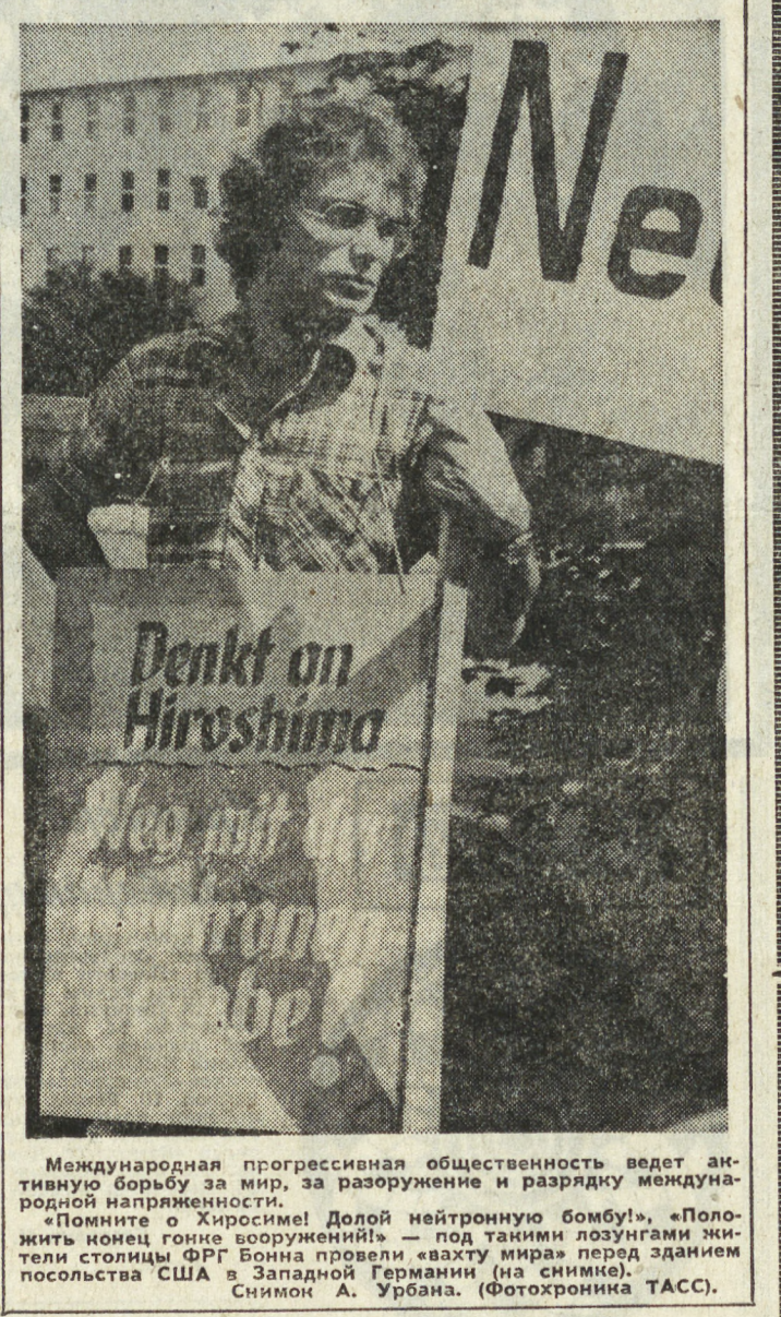
Международная прогрессивная общественность ведет активную борьбу за мир, за разоружение и разрывку международной напряженности.