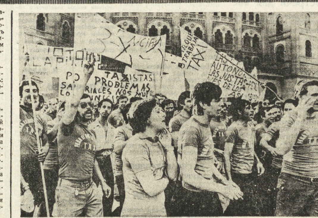
Последние недели были отмечены в Испании новым подъемом борьбы рабочего класса страны за свои социальные права. Бастовали строители провинции Кадекс и общины провинции Аликанте, пожарные и таксисты Мадрида, обслуживающая персонал Курьюри, Леона, другие отряды трудовой Испании. В центре требования трудящихся — увеличение заработной платы и улучшение условий труда.

НА СНИМКЕ: во время демонстрации водителей такси, выступивших в защиту своих жизненных интересов.