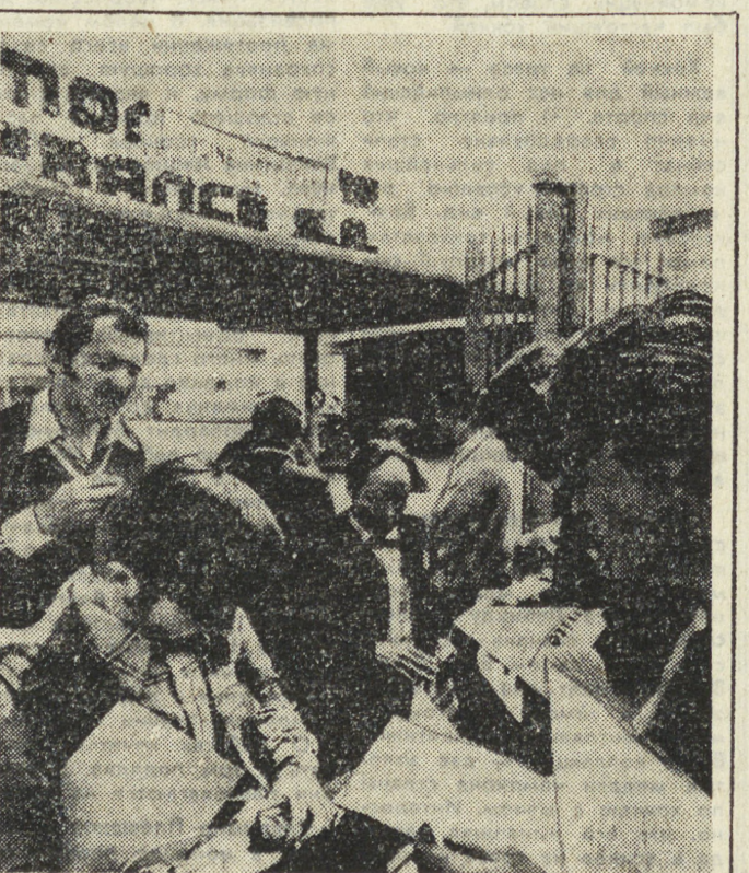
Франция. Уже несколько недель завод «Монтфибр» в департаменте Вогезы занят трудящимися в знак протеста против решения его владельцев закрыть предприятие и уволить более 1000 рабочих. Подобные действия современной администрации связаны в первую очередь с планами переноса части производства в Бразилию, где рабочая сила обходится намного дешевле, чем во Франции. Случай с заводом «Монтфибр» — далеко не единственное явление современной администрации. Многие предприятия доведенные до отчаяния рабочими стали распространять формулы борьбы за право на труд. НА СНИМКЕ: коммунисты распространяют газету «Юманите» среди бастующих рабочих «Монтфибра».

Согласно данным ООН, число заирских беженцев в Анголе достигло к настоящему времени более 220 тысяч человек. (ТАСС).