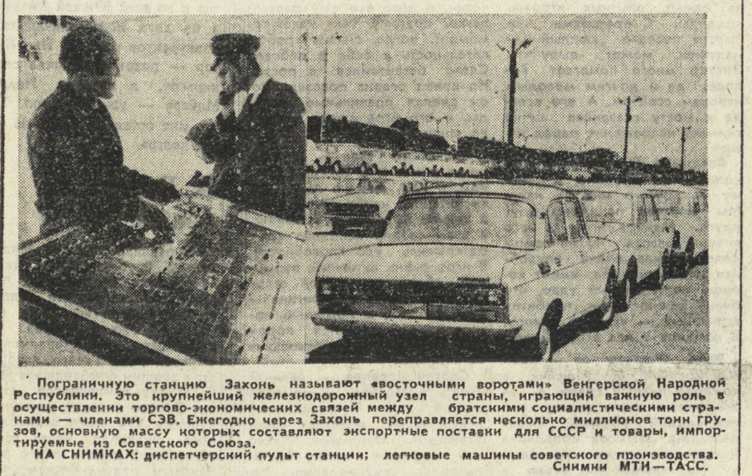
Пограничную станцию Законь называют «восточными воротами» Венгерской Народной Республики. Это крупнейший железнодорожный узел страны, играющий важную роль в осуществлении торгово-экономических связей между братскими социалистическими странами — членами СЭВ. Ежегодно через Законь перевозятся несколько миллионов тонн грузов, основную массу которых составляют экспортные поставки для СССР и товаров, импортируемых из Советского Союза.