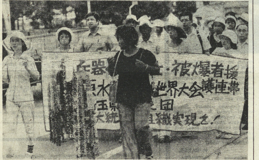
Прогрессивная общественность Японии — страны, пережившей трагедию Хиросимы и Нагасаки — ведет активную борьбу за запрет ядерного оружия, за разоружение, за разрядку международной напряженности. Участники массовой демонстрации, состоявшейся в Хиросиме, потребовали положить конец гонимому империалистическим силам, запретить производство нейтронов бомб и крылатых ракет. На сцене в руках демонстрантов — гирлянды бумажных журавликов в память о погибших от ядерных взрывов.