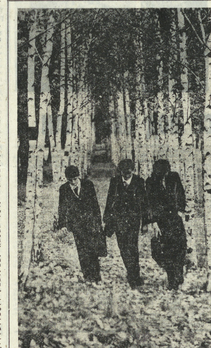
Один из первых дней учебного года... Мы идем в школу... Шуршат под ногами осенние листья...