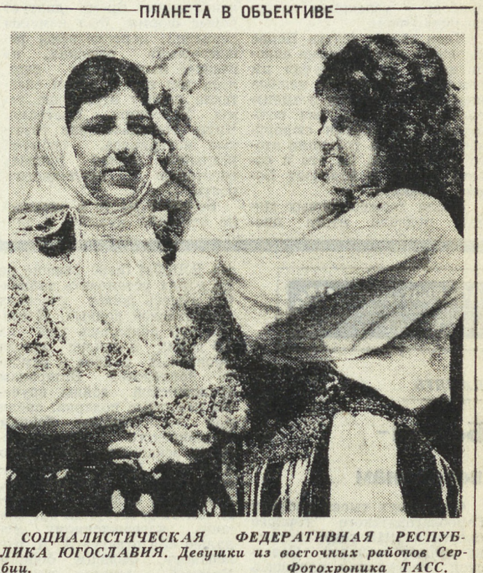
СОЦИАЛИСТИЧЕСКАЯ ФЕДЕРАТИВНАЯ РЕСПУБЛИКА ЮГОСЛАВИЯ. Девушки из восточных районов Сербии.