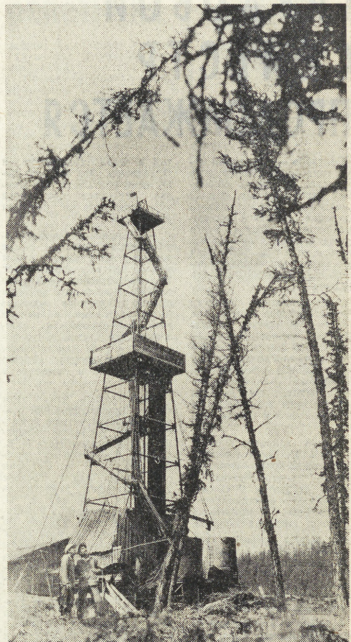
Земляничная нефтеразведочная экспедиция треста «Красноярскнефтегазразведка» ведет разведку нефтяных месторождений. Предполагаемое промышленное месторождение газа и нефти находится недалеко от районного центра Байрент. Оно названо в честь имени выдающегося нефтяника Н. И. Мухоморова. На снимке: буровая «Нуюбинская-2».