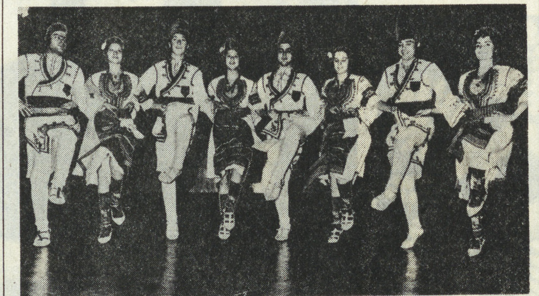
В городах и селах Народной Республики Болгарии насчитывается более 16 тысяч коллективов художественной самодеятельности. Только в прошлой году они дали свыше 80 тысяч концертов. Народные таланты Болгарии получили широкое признание на международных фестивалях, мотках и конкурсах. Сейчас участники музыкальных коллективов готовят программу и 60-летие Великого Октября. НА СНИМКЕ: участники