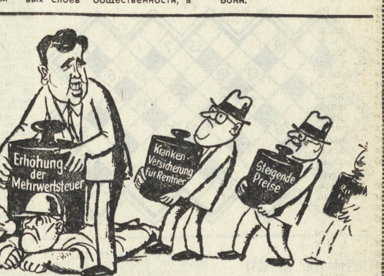
В условиях массовой безработицы, постоянного роста цен, серьезных недостатков в системе социального обеспечения новые тяготы несет населению ФРГ непрекращающееся повышение налогов. Карикатура из западногерманской газеты «Дойче фольксцайтунг».