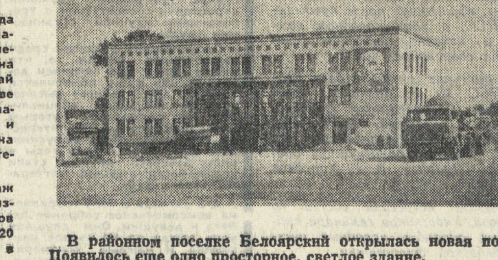
В районной поселке Белоярский открылась новая почта. Появилось еще одно просторное, светлое здание.