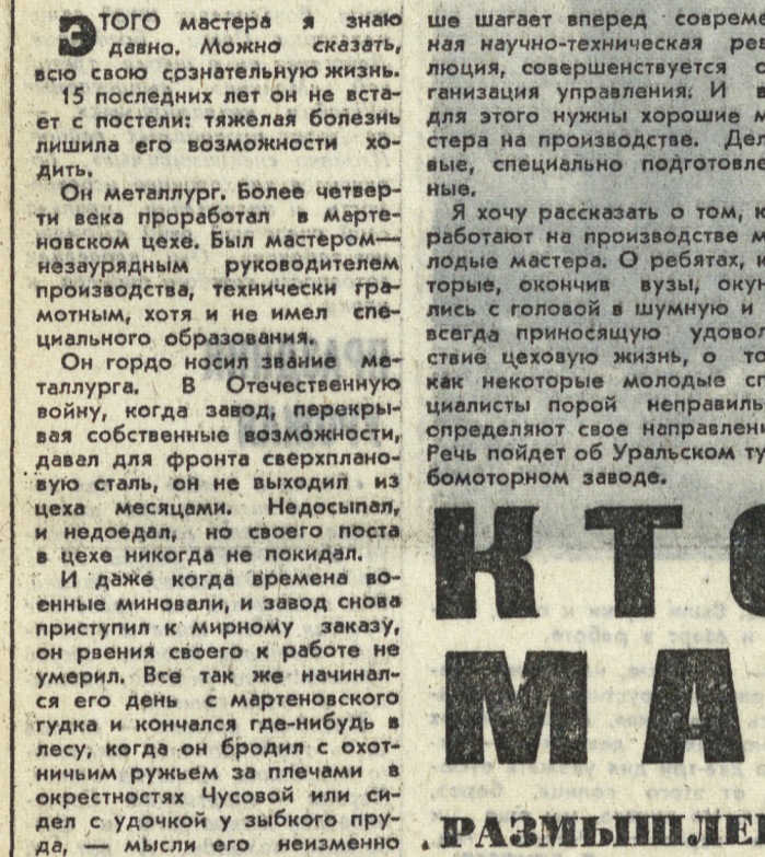
ЭТОГО мастера я знаю давно. Можно сказать, всю свою сознательную жизнь.

В ЗАДОРОЖНЫХ, секретарь Свердловского горкома ВЛКСМ.