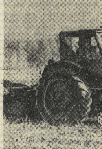
Трactor в поле.