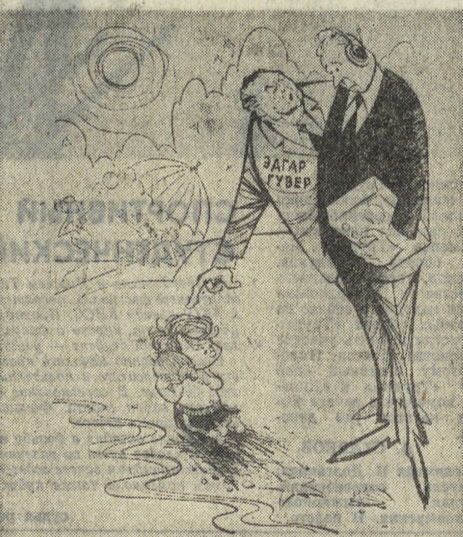
Директор ФБР Гувер своему подчиненному: — Скорее послушайте эту связь... Дело может касаться национальной безопасности. Рисунок из американской газеты «Ньюсеид».

Федеральное бюро расследований организовало широкую сеть шпионажа за американцами. (Из газет).