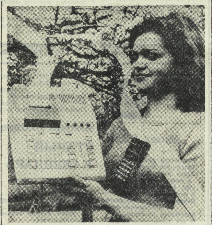
ПНР. Продукция завода электронной аппаратуры «Мера-Эльро» во Вроцлаве пользуется популярностью не только внутри страны, но и за рубежом. Недавно здесь выкатился выпуск электронных калькуляторов «Эльро-115» и «Эльро-480» (на снимке). Последний из них выдает результат вычисления, напечатанный на бумаге.