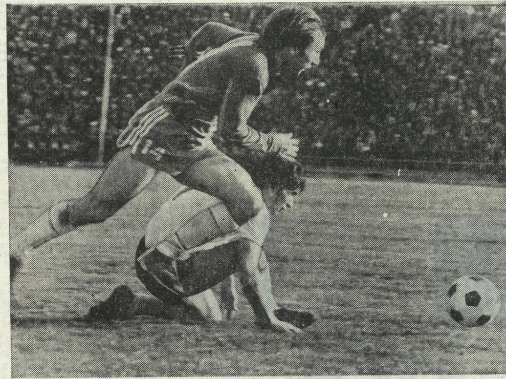
Юноша из команды «Михайловца».