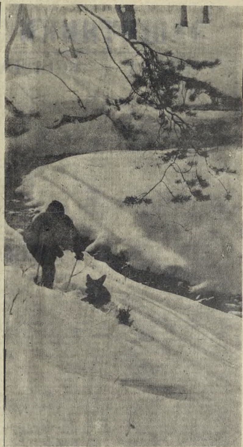
В воскресный день.

11.00 МОСКВА. Программа передач. 11.05 Гимнастика для всех. 11.30 Новости. 11.45 Цв. тел. «Украинские народные мелодии». 12.30 Для детей. «Считалочка». 13.00 «Писатель и его герои». 13.20 «Здоровье». Научно-популярная программа. 13.50 Заключительный концерт республиканского фестиваля танца в городе Кишиневе. 14.40 «Человек и закон». 14.55 Новости. 15.00 В эфире — «Молодость». 16.05 Международная панорама. 16.35 «Музыкальные встречи». 17.15 «Пойск». 18.00 Цв. тел. «Каменный гость». Фильм-опера. 19.30 Проблемы совершенствования управления народным хозяйством на основе применения экономико-математи-