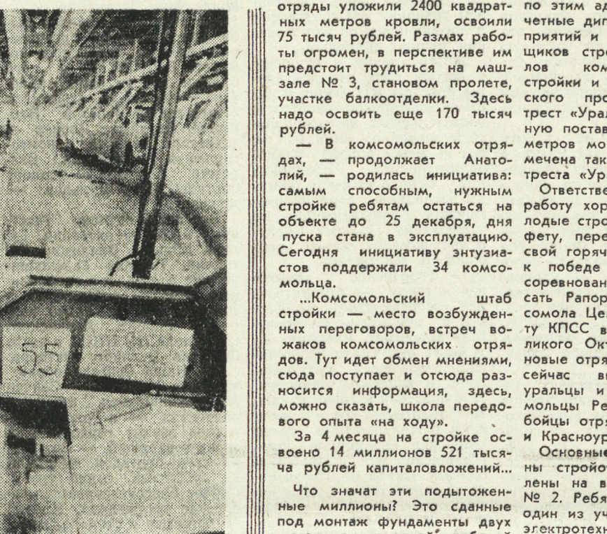
МОСКВА. Автомобильное производственное объединение «Автосиен» — одно из ведущих предприятий этой отрасли промышленности. Автоматизированная система управления, созданная в объединении «Автосиен» на его головном предприятии АЗЛК, позволяет решать вопросы управления контролем качества сборки автомобилей.

Как и десятки других рабочих и студенческих общежитий, это живет своей хлопотливой жизнью — со своими активностями и с нарушителями порядка. Почему ребята не включаются в общественную работу, почему одни из них готовят вечера отдыха и принимают в них самое активное участие, а другие в свободное время не вытаскивают из комнаты в красный уголок? Как заинтересовать их? Вначале мы пытались привлечь к составлению плана мероприятий всех ребят, — рассказывает Володя, — вывесили на доске примерный список возможных лекций, встреч, вечеров и попросили ребят отметить то, что им больше всего понравится, что их привлекает. Выбирай по душе! На основе этого списка составили план работы. Когда же стали проводить эти беседы или вечера, то оказалось, что ребята на них не идут. В красном уголке собираются, как правило, 10—15 человек. Проводили мы вечера отдыха в праздничные дни, готовили новогодний бал. А результат — тот же, правда, на танцевальные вечера ребята идут охотнее. Мы часто бываем на спектаклях в театре драмы. В последнее время установили с этим коллективом творческие связи. В январе и марте актеры театра были гостями нашего общежития. На первую встречу мы собрались в нашем буфете за чайной чашкой. Актеры рассказали о своей работе, о планах театра. А на последней встрече, которую проводили в красном уголке, шло обсуждение спектаклей «Сладкоголосая птица юности» и «Доктор Назаров». Обе эти встречи были, конечно же, очень интересными, но народу на них было мало.