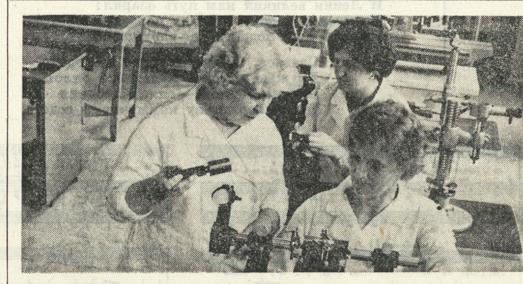
В лаборатории технических измерений Свердловского завода коммунального машиностроения, где ведется контроль измерительных приборов и инструментов, работает всего 7 человек. Но от них зависит многое. Ведь инструментами и приборами, которые проходят проверку в лаборатории, работают контролеры ОТК. Качество приборов и инструментов во многом обеспечивает качество продукции.

— Здесь трудно определить, что важнее: изделие должно «радовать глаз»? Отвечать техническим требованиям? Или то и другое вместе? Я считаю, если это изделие — пусть у нее будет брак. Прежде всего. Ведь мы станем мы покупать костюм, лишь из-за того, что он шит из крепкого материала и проносится не один год. Мы хотим иметь красивый и удобный костюм. А нужна ли внешняя красота заводской продукции? У нас на заводе произошел такой случай. Из-за того, что выпускаемая продукция была не красиво упакована в непригодную и неудобную тару, на которой не было знака предприятия, на производстве находился крупный штраф. В принципе, верно. Но я считаю, что в заводской продукции главное —