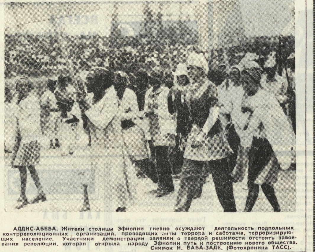
АДДИС-АБЕБА. Жители столицы Эфиопии гневно осуждают деятельность подпольных контрреволюционных организаций, проводящих акты террора и саботажа, терроризируя население. Участники демонстрации заявили о твердой решимости отстаивать завоевания революции, которая открыла народу