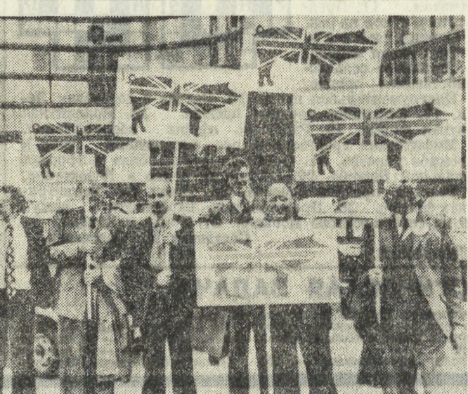
В Англии продолжаются выступления за выход страны из «Общего рынка»...