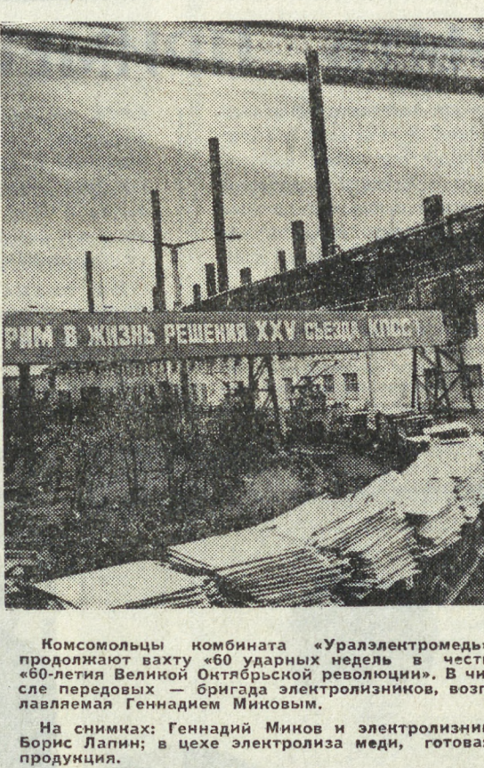
Готовимся к всесоюзному комсомольско-молодежному субботнику