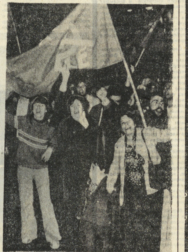
МАДРИД. Легализация Коммунистической партии Испании — крупная победа всех демократических сил страны.