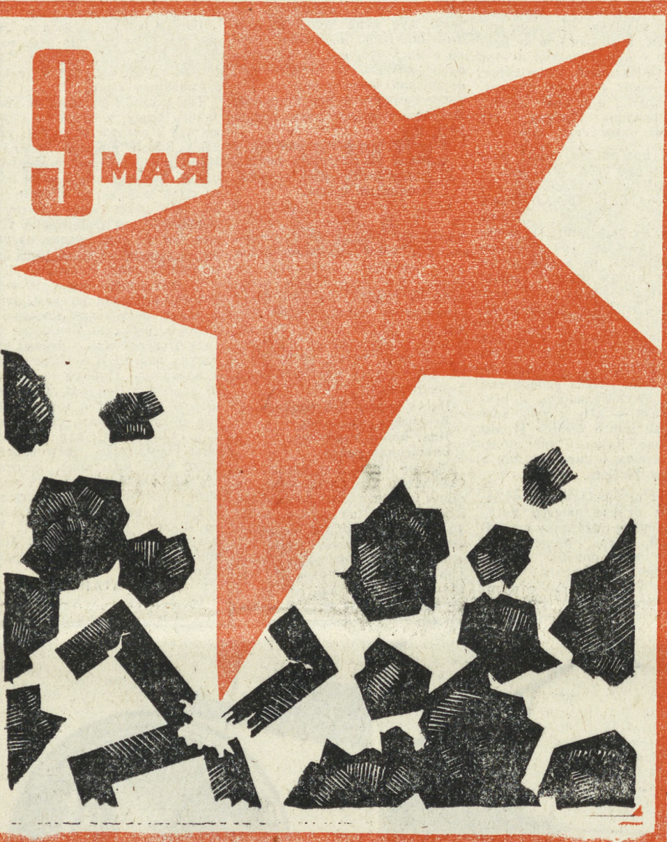
Плакат Р. КАПТИКОВА.