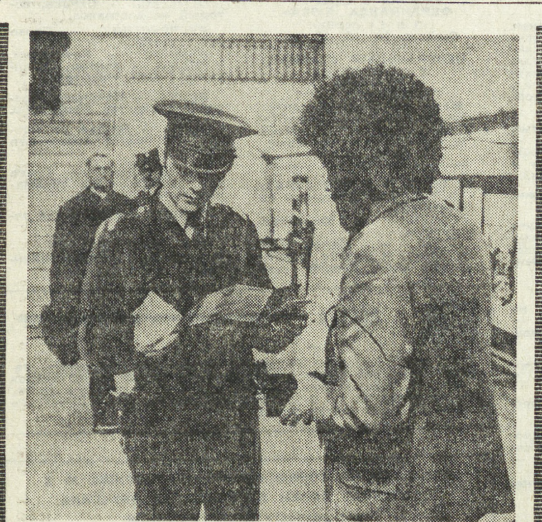
800 полицейских каждый вечер направляются теперь в Парижское метро. Их задача усилить службу безопасности на 347 станциях и 200 километрах подземных коридоров французской столицы.