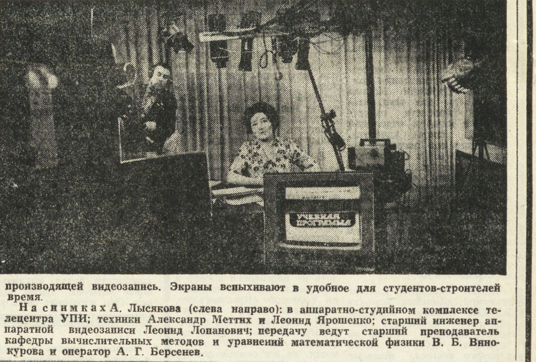
производящей видеозапись. Экраны всматривают в удобное для студентов-строителей время.