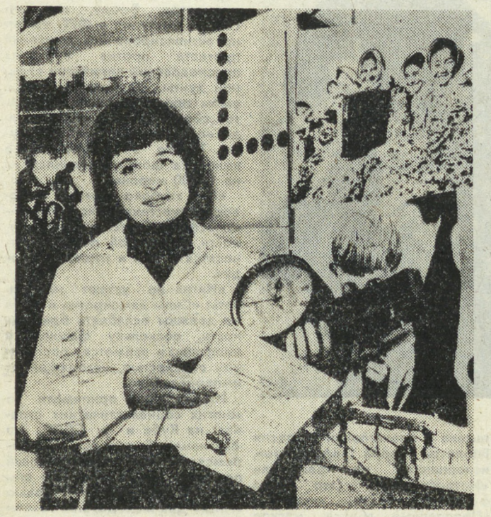
ПНР. Завершилась восьмая всесоюзная олимпиада русского языка для учащихся средних школ. В ней приняло участие свыше сорока тысяч человек. Участники финала, а их было 150, продемонстрировали высокий уровень знаний...