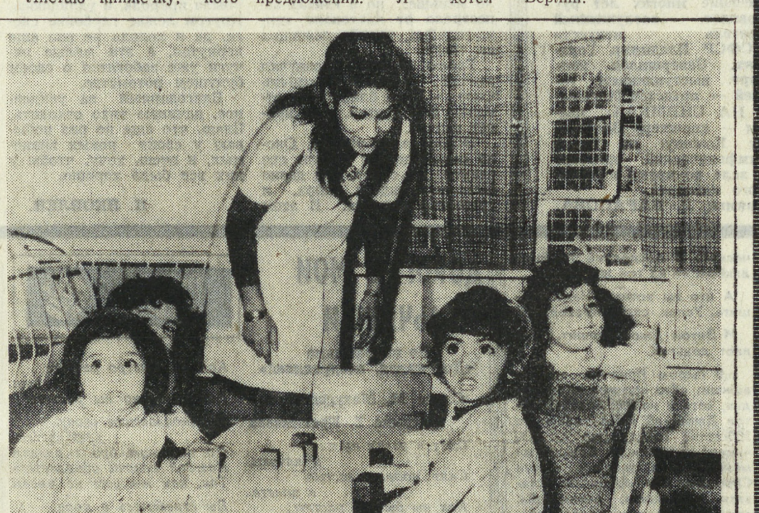
Правительство Иракской Республики проявляет большую заботу о подрастающем поколении. Из государства вытеснены детские дошкольные учреждения. В настоящее время в стране действуют 248 детских садов, которые посещают 48,7 тысячи иракских детей. НА СНИМКЕ: в одном из детских садов. Здесь дети окружены вниманием и заботой.