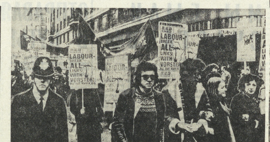
«Долой апартеид», «Превратим в оружие ЮАР» — под такими лозунгами в Лондоне состоялась массовая демонстрация.

НАМ ТОЛЬКО ЧТО СООБЩИЛ ТЕЛЕТАЙП. ЛОНДОН. Новая вспышка насилие и террора охватила Северную Ирландию.