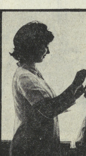
Знакомьтесь: делегат XVI съезда профсоюзников СССР

Инициативы передовых рабочих получили поддержку среди всей молодежи завода. Победителям названы Подведены очередные итоги социалистического сорев-