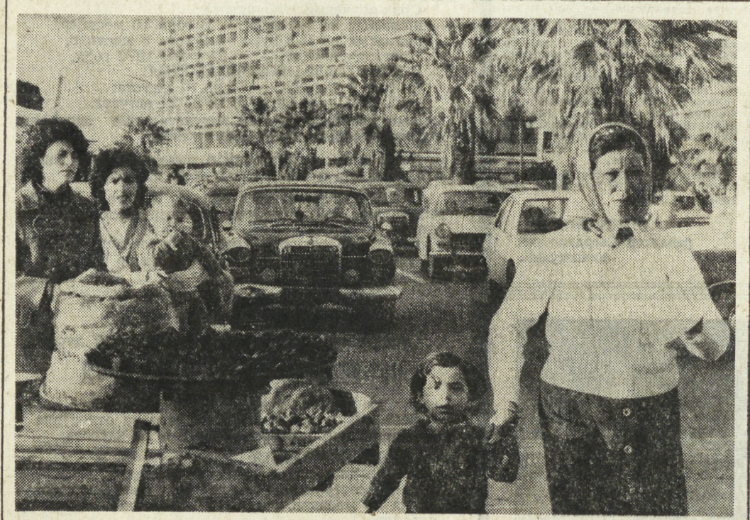
В Ливане продолжается процесс превращения в жизнь решений совещаний глав государств и правительств арабских стран в Эр-Рияде и Каире, посвященных восстановлению мира и безопасности после длительной гражданской войны в этой стране. Осуществление этих решений возможно на находящейся в Ливане мейрабессе силы по подкреплению мира. НА СНИМКЕ: мирные будни Бейрута.

сил в будущем парламенте, которое гарантировало бы поддержку всех резолюций, отвергающих какие-либо территориальные уступки Израилю, особенно на западном берегу реки Иордан и в секторе Газа. Именно эти территории должны стать базой будущего палестинского государства при мирном урегулировании ближневосточного кризиса в соответствии с решениями ООН. (ТАСС).