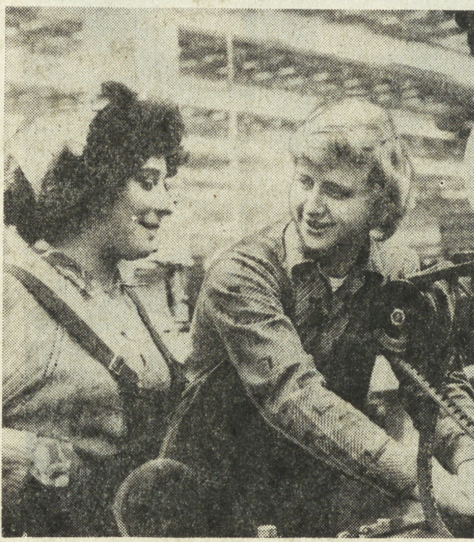
МОСКВА. В цехах и бригадах автомобильного завода имени И. А. Лихачева широко развернулось социалистическое соревнование в честь 60-летия Великого Октября.

Веселый вклад в выполнение обязательств вносит 20-тысячный отряд комсомольцев и молодых производственников автозавода.