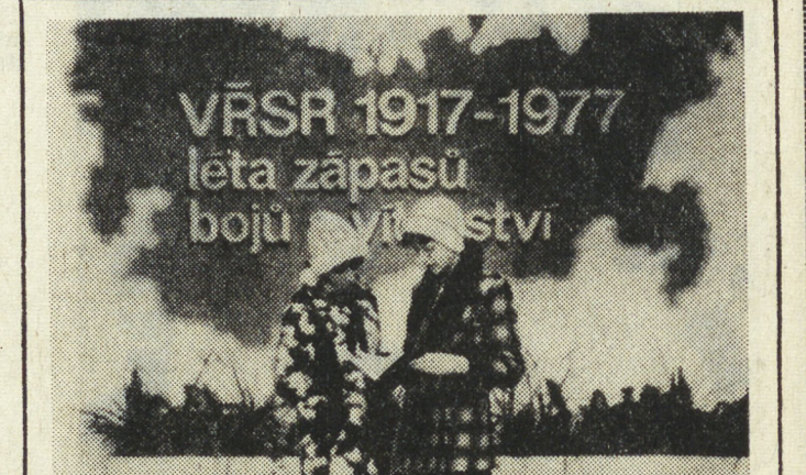
ЧССР. В выставочном зале Союза чехословацко-советской дружбы в Праге открылась выставка советской книги, посвященная 60-летию юбилею Великой Октябрьской социалистической революции.

Вотаманду. Здесь открылся семинар ООН по вопросам участия женщин в политическом, экономическом и социальном развитии. Семинар проводится для стран района Азии и Тихого океана.