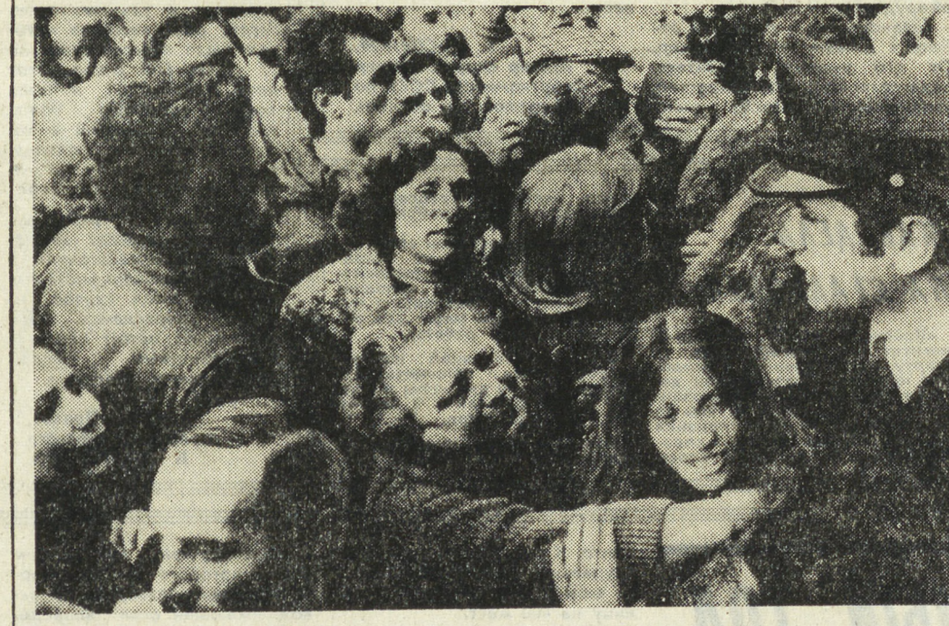
ИТАЛИЯ. Монополистические круги стараются переложить трудности преодоления экономического кризиса, переживаемого страной, на плечи трудящихся.

Наконец Пабло глубоко и с болью вздохнул, но не проронил ни слова. Снова последовала длительная молчаливая пауза.