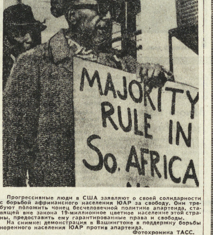
Прогрессивные люди в США заявляют о своей солидарности с борющейся африканской нацией ЮАР за свободу.

В Японии начался суд над главными участниками дела «Локхид». На скамью подсудимых токйского районного суда сели бывший премьер Японии К. Танака и еще четыре господина из правления корпорации «Марухири».