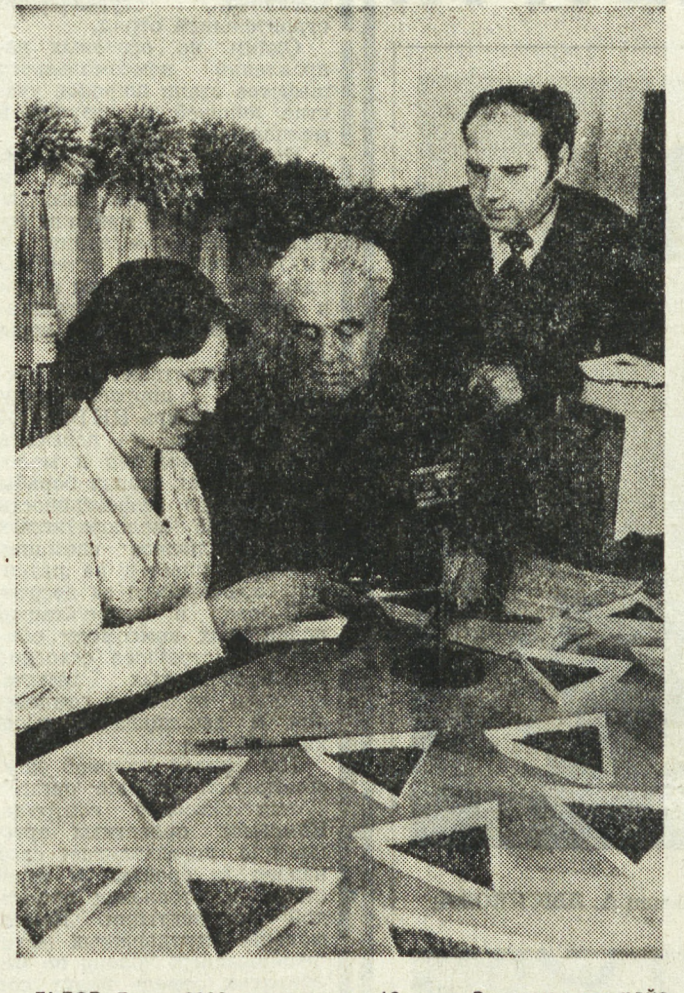
Львов. Более 2000 учащихся из 12 школ Завязинского района города занимаются в межшкольном учебно-производственном комбинате...