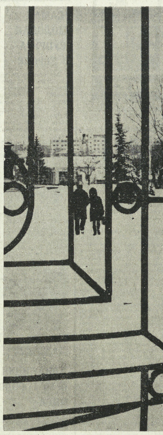
Какая грусть! Конеч аллеи Опять с утра исчез в пыли, Опять серебряные змеи Через суровые пологали. А. ФЕТ. Снимки А. Лыскова.

Еще четыре тысячелетия назад египтяне использовали лук для роста и укрепления волос. Современная наука открыла в луке много ценных веществ и витаминов, благоприятно влияющих на организм. А в шелухе обнаружено особое соединение кератин, окрашивающее волосы в красивые оранжево-красноватые тона. Для того, чтобы приготовить маску, нужно в течение 15-20 минут кипятить 30-50 г луковой шелухи в 200 г воды. Дать настояться, и затем процедить.