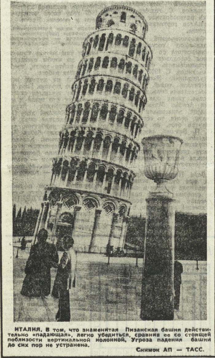
ИТАЛИЯ. В том, что знаменитая Пизанская башня действительно «падала», легко убедиться, сравнив ее со ступней...