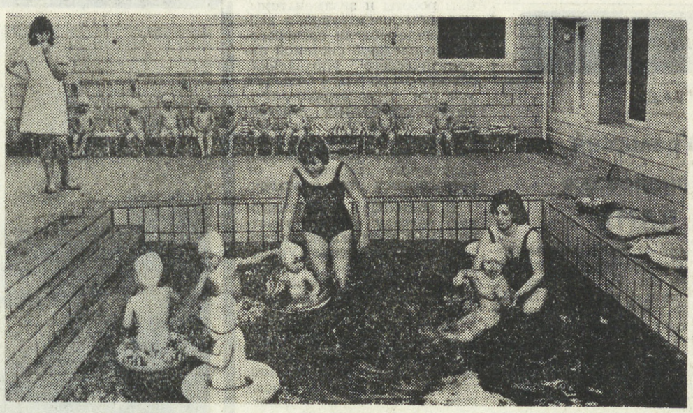
В бассейне, которым располагают ясли в Торгау (ГДР), дети в возрасте от 16 месяцев до 3 лет получают необходимую закалилку...