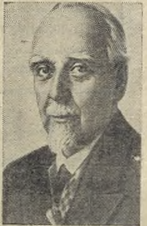
Г. М. Кржижановскому 24 января исполнилось 100 лет со дня рождения.

Всю свою жизнь известный советский государственный и партийный деятель, ученый-энергетик Глеб Максимилианович Кржижановский [1872 — 1959] посвятил народу, Родине, коммунизму. Друг и соратник В. И. Ленина, он был активным участником первой русской революции. После Октября занимался электрификацией страны. По поручению В. И. Ленина Г. М. Кржижановский в 1920 году возглавлял Комиссию по электрификации России [ГОЭРЛО]. Он—автор ряда научных трудов в области энергетики, был вице-президентом Академии наук СССР.