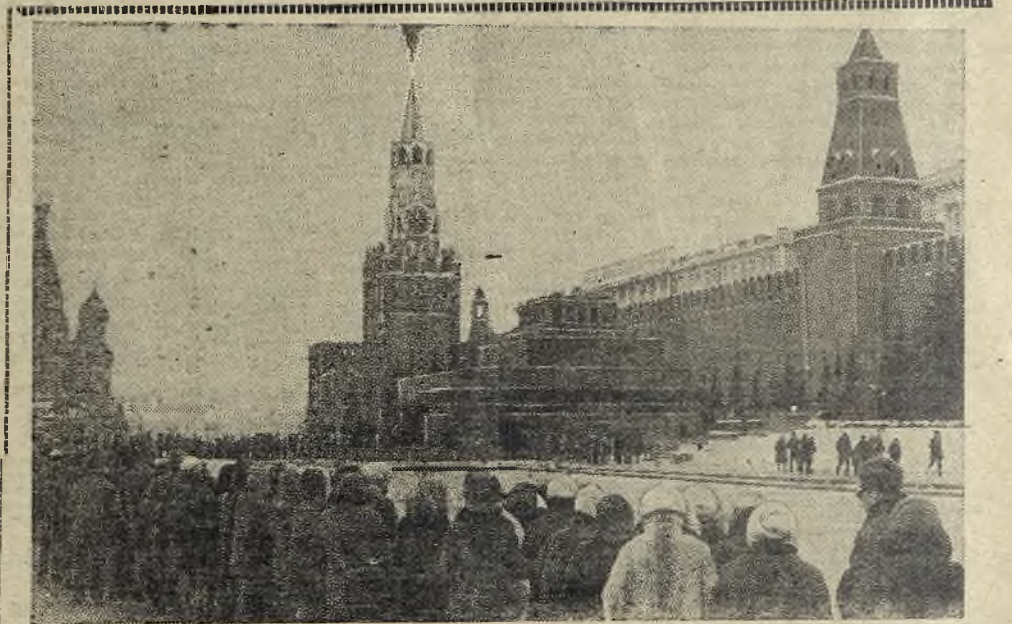
МОСКВА. Красная площадь. Мавзолей В. И. Ленина.

Всю свою жизнь известный советский государственный и партийный деятель, ученый-энергетик Глеб Максимилианович Кржижановский [1872 — 1959] посвятил народу, Родине, коммунизму. Друг и соратник В. И. Ленина, он был активным участником первой русской революции. После Октября занимался электрификацией страны. По поручению В. И. Ленина Г. М. Кржижановский в 1920 году возглавлял Комиссию по электрификации России [ГОЭРЛО]. Он—автор ряда научных трудов в области энергетики, был вице-президентом Академии наук СССР.