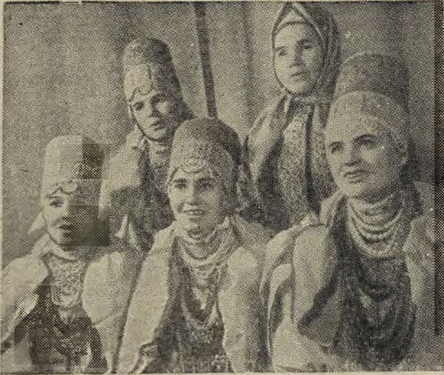
В Архангельской области проходит телевизионный фестиваль самодеятельного искусства, посвященный 50-летию образования Союза Советских Социалистических Республик. Участвуют в фестивале и самодеятельные артисты села Карпогоры. Карпогорский народный хор представлял фольклор Российской Федерации на международном фестивале в Югославии. На снимке: солистки хора.