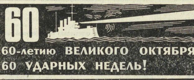
60-летию ВЕЛИКОГО ОКТЯБРЯ — 60 УДАРНЫХ НЕДЕЛЬ!