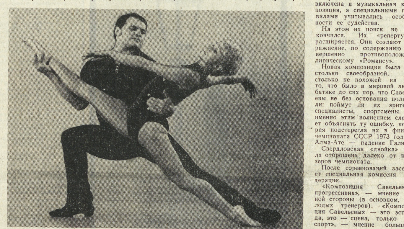
На их тренировку передо...