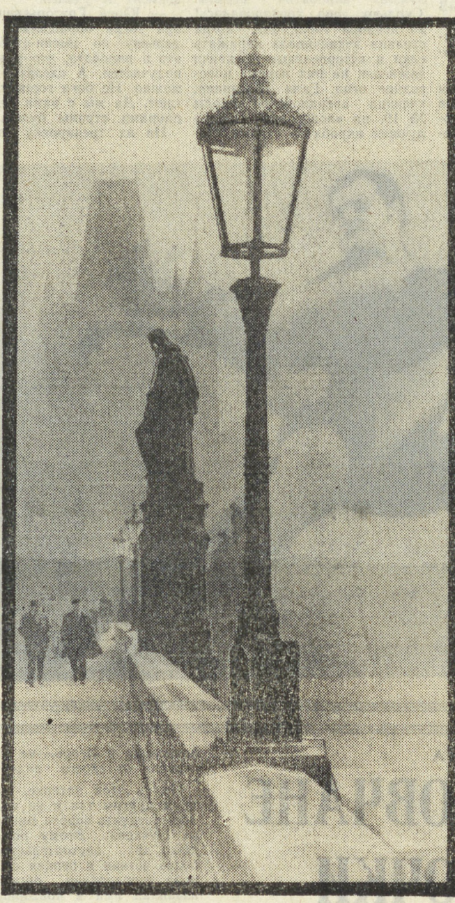
На снимках: вожатые делятся опытом (вверху справа); на Карловом мосту в Праге; в одной из пражских школ свердловчан провожали песни.