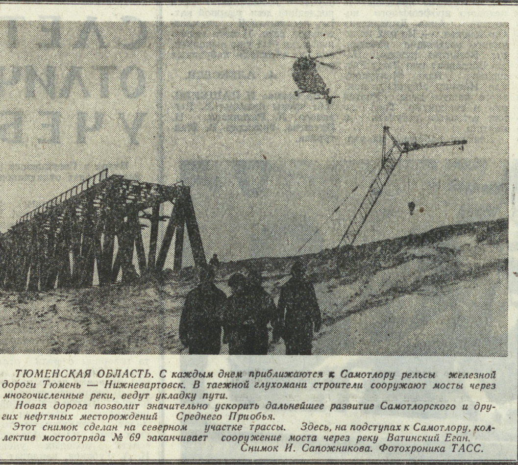
ТОМЕНСКАЯ ОБЛАСТЬ. С каждым днем приближаются к Самолору рельсы железной дороги Тюмень — Нижнеурт. В таежной глухомани строители сооружают мосты через многочисленные реки, введут кладку пути. Новая дорога позволит значительно ускорить дальнейшее развитие Самолурского и других нефтяных месторождений Среднего Приобья. Этот снимок сделан на северном участке трассы. Здесь, на подступах к Самолору, коллектив мостостроителей № 69 заканчивает сооружение моста через реку Ватинский Еган.