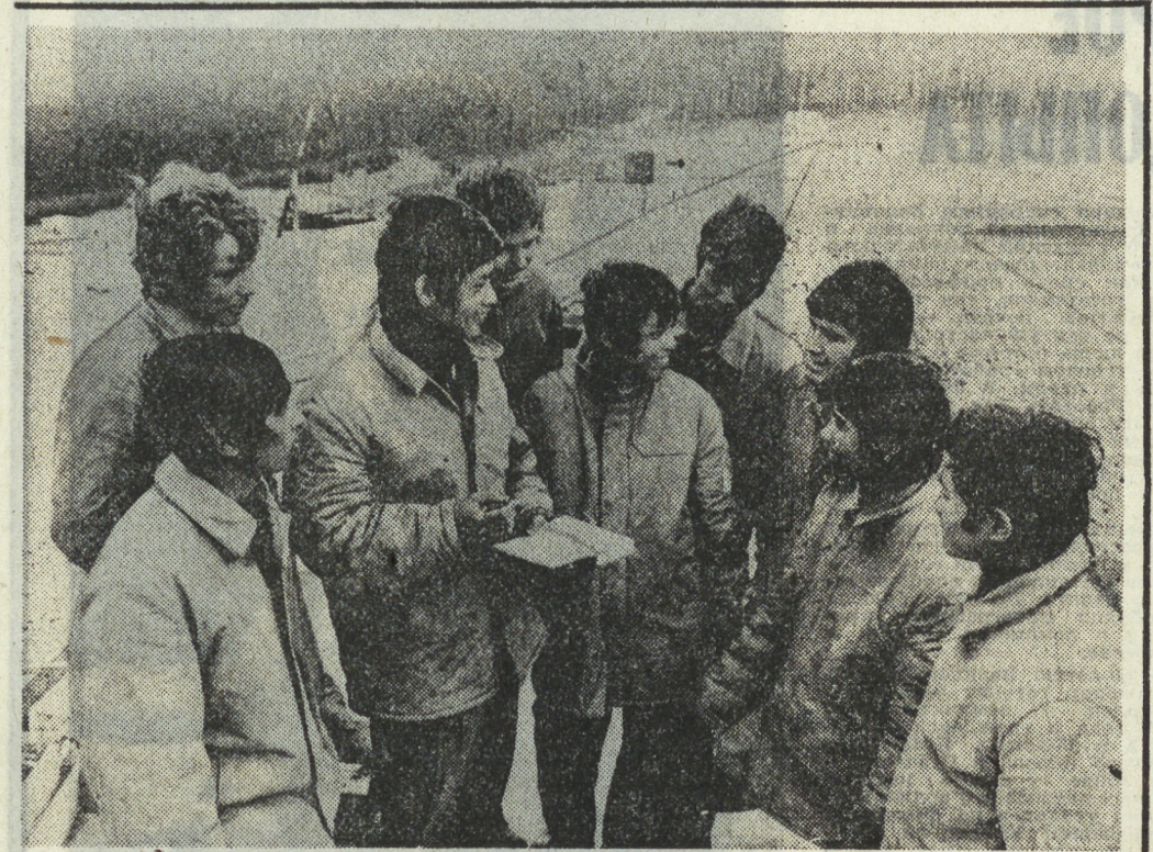
В строительстве плотин Присечинне в ЧССР принимали участие интернациональные бригады. Бок о бок с чехами и словаками трудились послышки Социалистической Республики Вьетнам. На снимке: обсуждение работы в интербригаде.