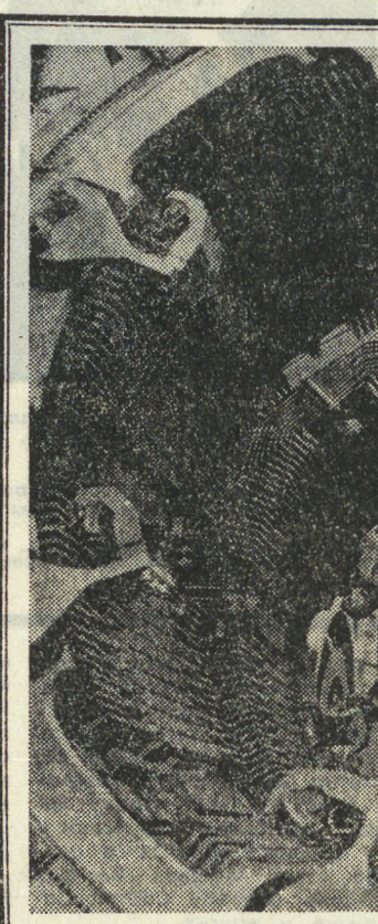
ХАРЬКОВ. Электромеханический завод имени 50-летия Великой Октябрьской социалистической революции.

В заключение остается напомнить, что за всеми спрашиваемыми о поступлении на подготовительное отделение следует обращаться по адресу: г. Свердловск, К-83, пр. Ленина, 51, университет, подготовительное отделение, комн. 417, тел. 58-66-23. Общественные приемные комиссии будут в городах Каменск-Уральском и Нижнем Тагиле.