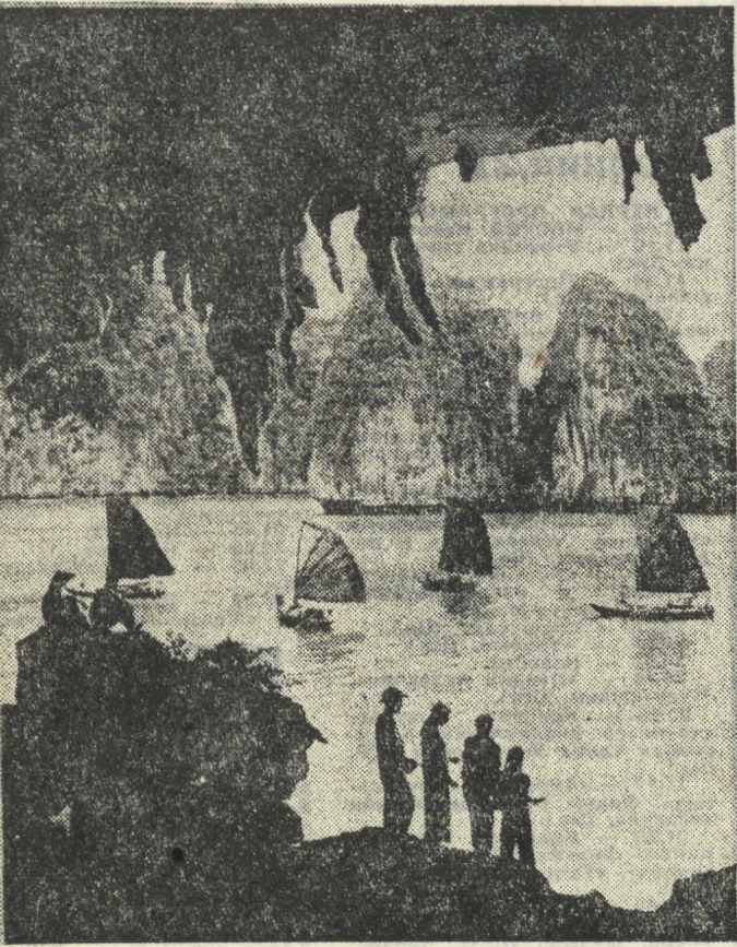
Вьетнам. Залив Ха Лонг с бесчисленными крошечными островами и красивыми пещерами — настоящий рай для туристов.