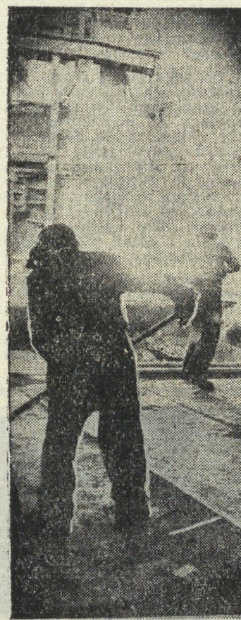
Металлурги сталеплавильного цеха Верх-Исетского металлургического завода развлекли соревнования по достижению 250-летия предприятия. К этой дате они обещали выплавить 100 тонн сверхпланового металла, из них около 50 процентов высококачественной стали.

Воспитывать у каждого молодого человека коммунистическое отношение к труду и общественной собственности, чувство хозяина страны, неприимность к недостаткам, стремление к экономии и бережливости.