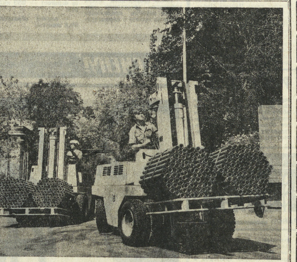
ВОЛГОГРАД. Производство Волгоградского производственного объединения тракторных деталей и нормалей идет все ускоренными темпами. На предприятии большое внимание уделяется совершенствованию системы пакетных перевозок. Так, пружины горючей навески для тракторов отгружаются потребителям пакетами по 700 килограммов. Весомое преимущество этой системы — сохранение продукции при транспортировке, на 23—30 процентов сокращается себестоимость переработки грузов, вдвое сокращаются простои транспорта.