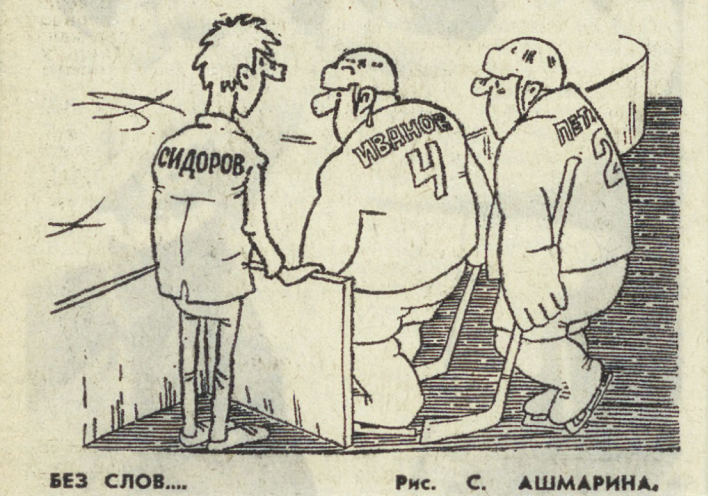
Без слов... Рис. С. АШМАРИНА.