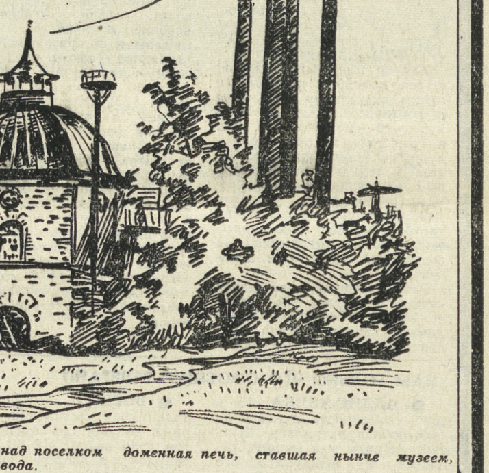
Высоко возмывалась когда-то над поселком доменная печь, ставшая нынче музеем, переросли ее трубы новых цехов завода.

11-12 августа по области ожидается переменная облачность, местами кратковременные дожди и грозы.