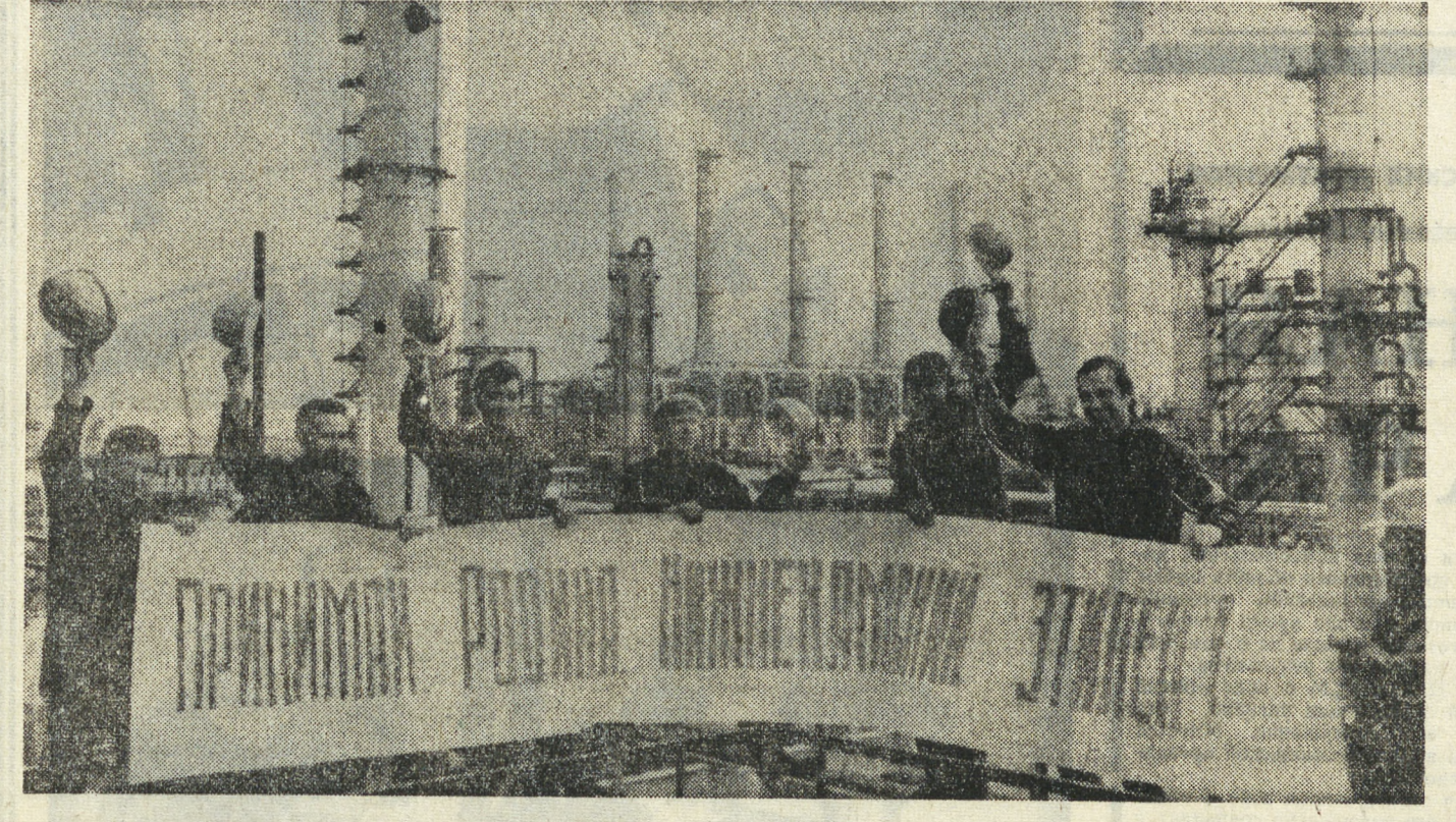
ТАТАРСКАЯ АССР. На Нижнекамском нефтехимическом комбинате вошла в строй действующих уникальная установка «Этилен-450»

Сейчас я уже работаю самостоятельно, но нет-нет, да и зайду в наше СКБ. Там уже новое поколение студентов. Смотрю на них и думаю: ведь здорово вам, ребята, повезло, у вас такой наставник.