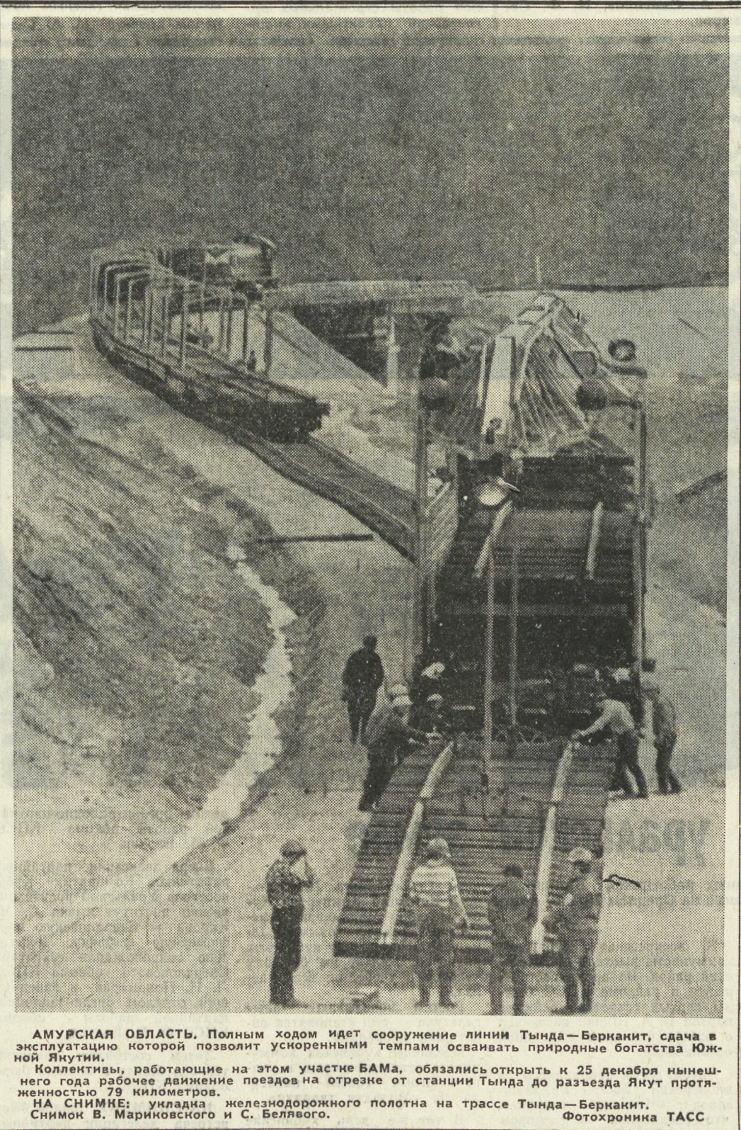
АМУРСКАЯ ОБЛАСТЬ. Полным ходом идет сооружение линии Тында—Берканиг, сдача в эксплуатацию которой позволит ускоренными темпами осваивать природные богатства Южной Якутии.