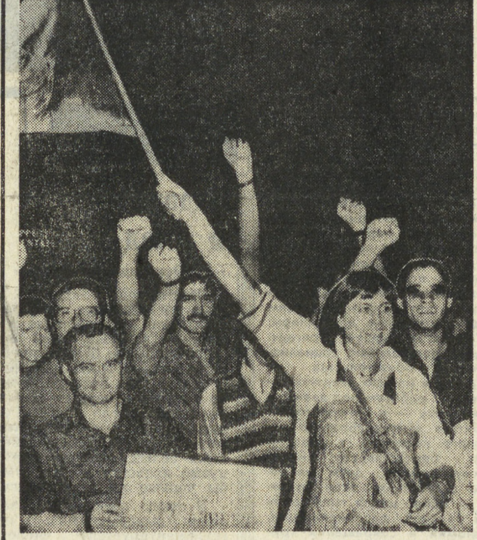
Итальянская коммунистическая партия добилась крупного успеха на внеочередных парламентских выборах. Тысячи жителей Рима заполнили в ночь на 22 июня площади перед зданием ЦК Итальянской компартии в ожидании результатов выборов. Обнажившись к собранию, Генеральный секретарь ИКП Энрико Берлингуэр подчеркнул, что компартия, как показывая результаты выборов, сделала решающий шаг вперед в борьбе за интересы трудящихся и единство трудового народа. На снимке: во время митинга у здания ЦК ИКП.

Но почему же в таком случае некоторые официальные представители боннских ведомств и партий коалиции приняли активное участие в ревизионском шабаше? Здесь нередко говорят и пишут о том, что леволберальная коалиция в канун выборов в бундестаг вынуждена, дескать, заигрывать с «союзниками изгнанных», располагая значительным резервом голосов. Но политика разрядки, интересы всеобщего мира — слишком важное дело, чтобы жертвовать им ради конъюнктурных выгод. Прогрессивная и значительная часть леволберальной общности ФРГ выражает недоумение и тревогу по поводу малопопытной политики поощрения деятельности ревизионских землячеств.