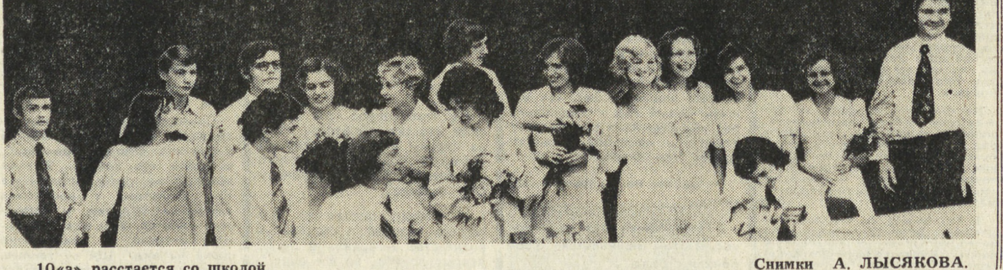
10«а» расстается со школой.