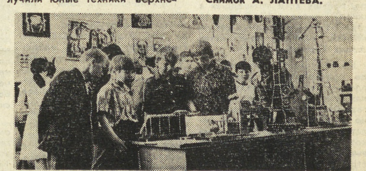
Снимок А. ЛАПТЕВА.

Диплом первой степени получили юные техники Верхне-... Снимок А. ЛАПТЕВА.