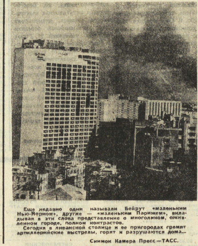
Еще недавно одни называли Хельсинки «маленьким Парижем», выходящим в элитные кварталы о многолюдном, оживленном городе, полном контрастов. Сегодня в лианской столице и ее пригородах гремит артиллерийские выстрелы, горят и разрушаются дома...