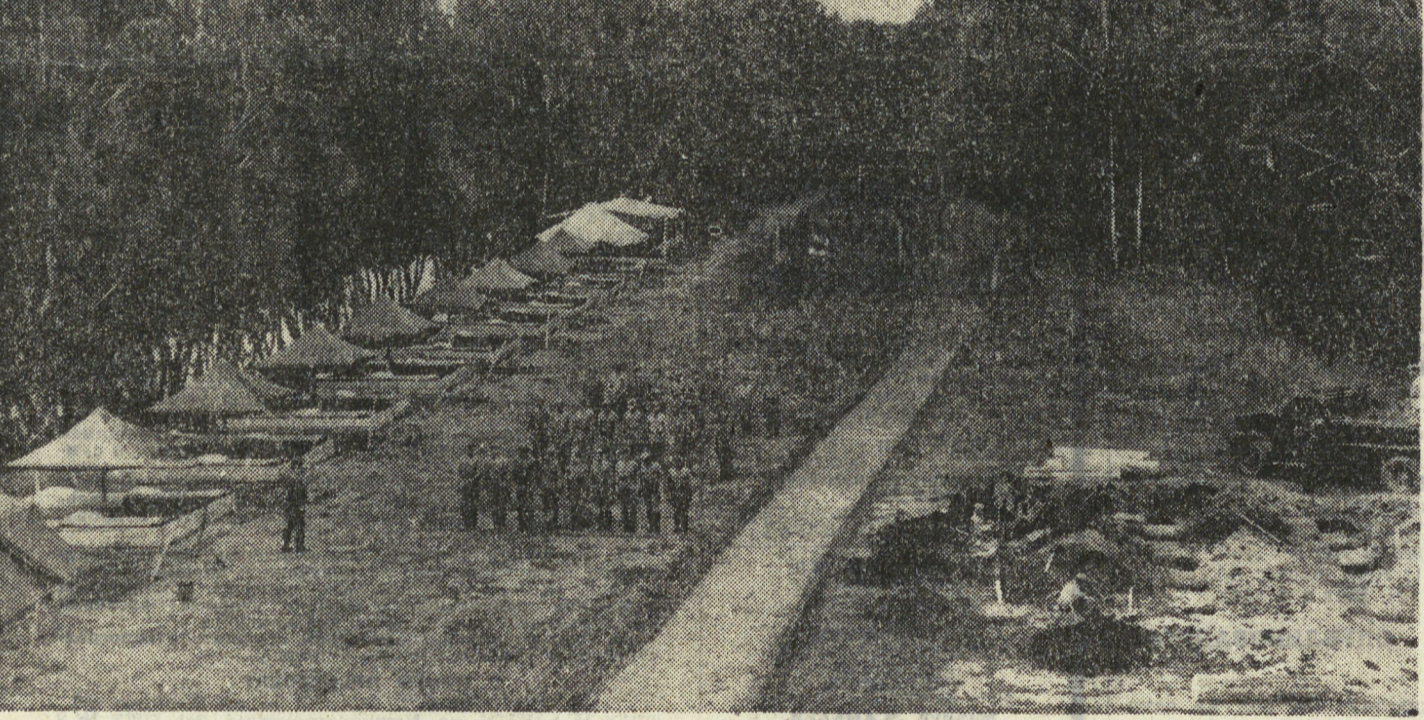
На снимке: утреннее построение.