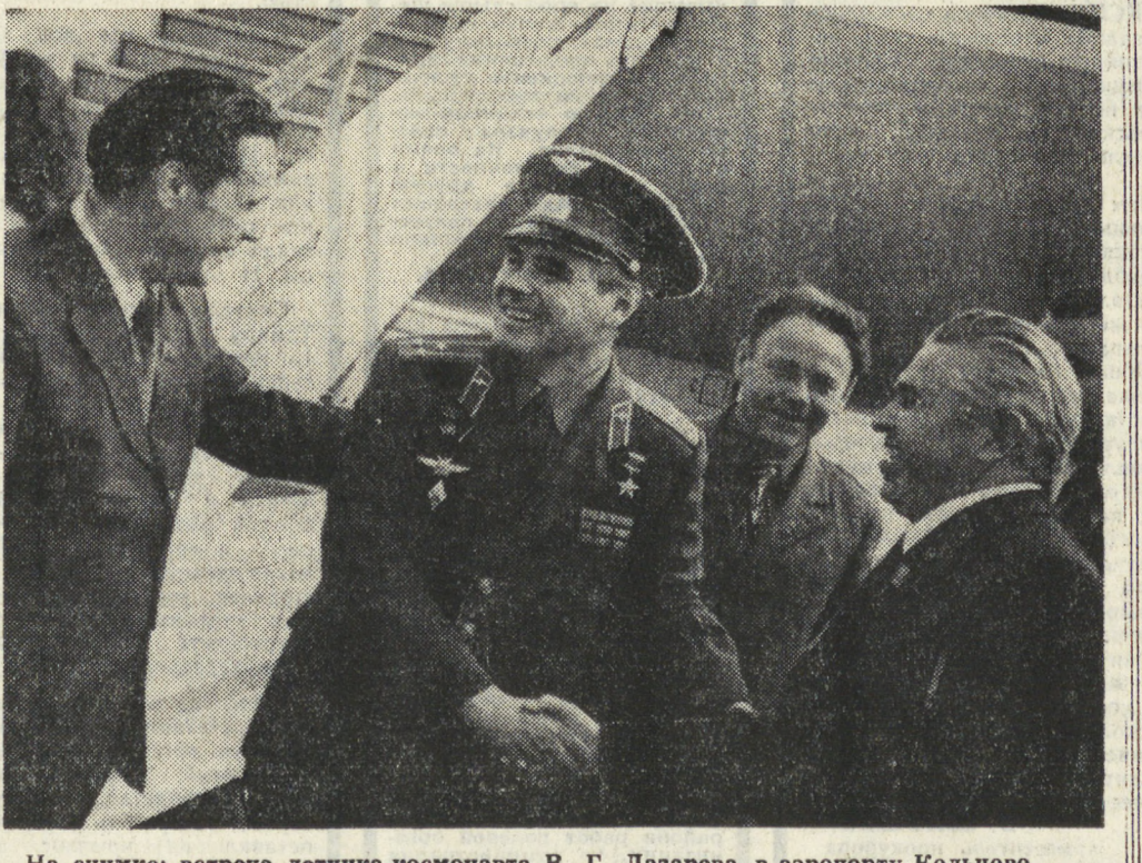
На снимке: встреча летчика-космонавта В. Г. Лазарева в аэропорту Кольцово.