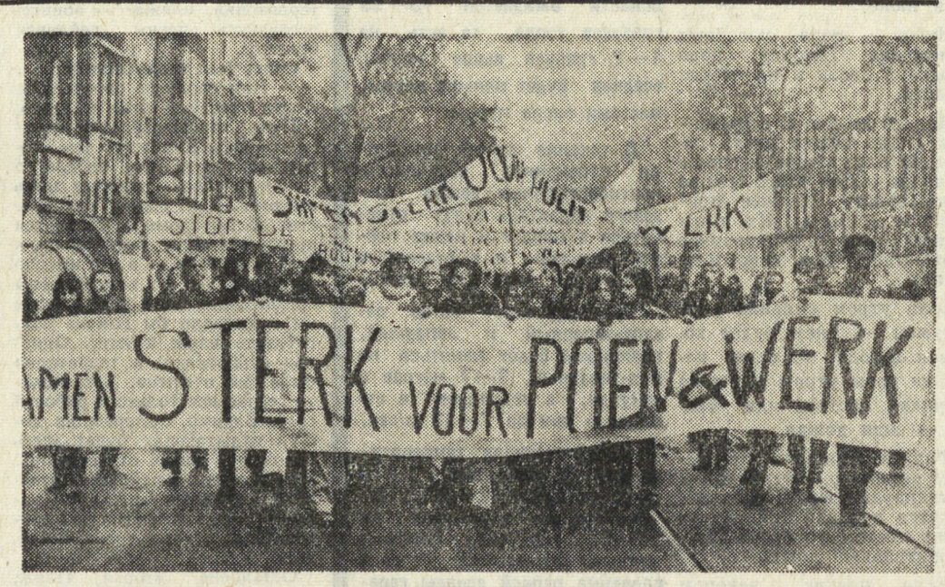
ГОЛЛАНДИЯ. Представители 80-тысячной армии безработной молодежи страны вышли на улицы.

ТРИНАДЦАТЬ лет назад представители более тридцати независимых африканских государств собрались в Аддис-Абебе, где провозгласили создание Организации африканского единства и приняли 25 мая ее Хартию. Этот день народы мира отмечают как День освобождения Африки. Еще недавно Африка представлялась империалистическим кругам «стабильным» континентом. На ее несметные богатства рождался стремительный рост империалистической эксплуатации, не имеет ничего общего с так называемой американской помощью, которая состоит в том, что правая рука дает крохи, а левая забирает огромные прибыли. В связи с Днем освобождения Африки настоятельный долг всех народов мира — отдать дань уважения Советскому Союзу и другим странам социалистического сотрудничества за конкретную и бескорыстную помощь, которую они оказывают национально-освободительным движениям и независимым странам Африки в их борьбе за полное освобождение от ита колониализма и неоколониализма, за прогресс, свободу и мир для всех народов.