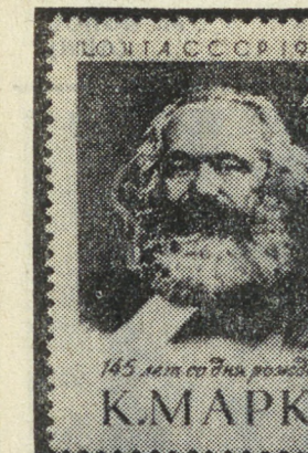
145 лет со дня рождения К. МАРКС

День печати мы отмечаем в день выхода первого номера газеты «Правда» — 5 мая (по старому стилю 22 апреля) 1912 года.