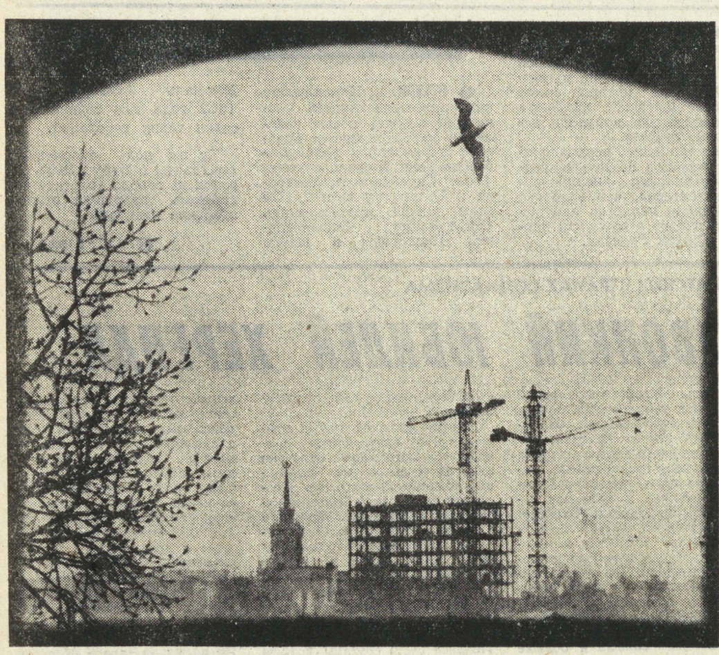
Утро города.

Здесь же, на племзаводе «Пионер», работает его жена. А дочь, будущая девятиклассница, научилась водить трактор и заняла первое место в районе среди юных трактористов школьных производственных бригад. Сейчас она учится в индустриально-педагогическом техникуме. Много теплых слов было сказано на вечер в адрес Упоровых. За импровизированным застольем им представляется самое почетное место и преподносится пахучий каравай. Со слезами звучат песни, исполняются танцы в честь почетных гостей, мелькают кадры доблестной киноленты. И в конце вечера труд и жизни семьи Упоровых.