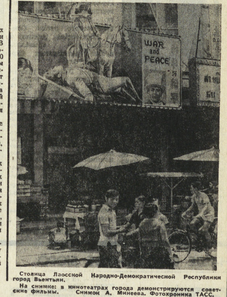
Студия Лаосской Народно-Демократической Республики в городе Вьентiane. На снимке: в кинотеатрах города демонстрируются советские фильмы.

Уроки русского языка передаются по финскому телевидению два раза в неделю. Их смотрят около 200 тысяч финнов. Программу «Раз, два, три» готовят совместно советские и финские ученые. Один из авторов этих передач — преподаватель Хельсинкского университета Арто Мустьяйнен сообщил, что уже продано около 40 тысяч учебников для слушателей программы. Это означает, что еще тысячи финнов заняты за изучением русского языка.