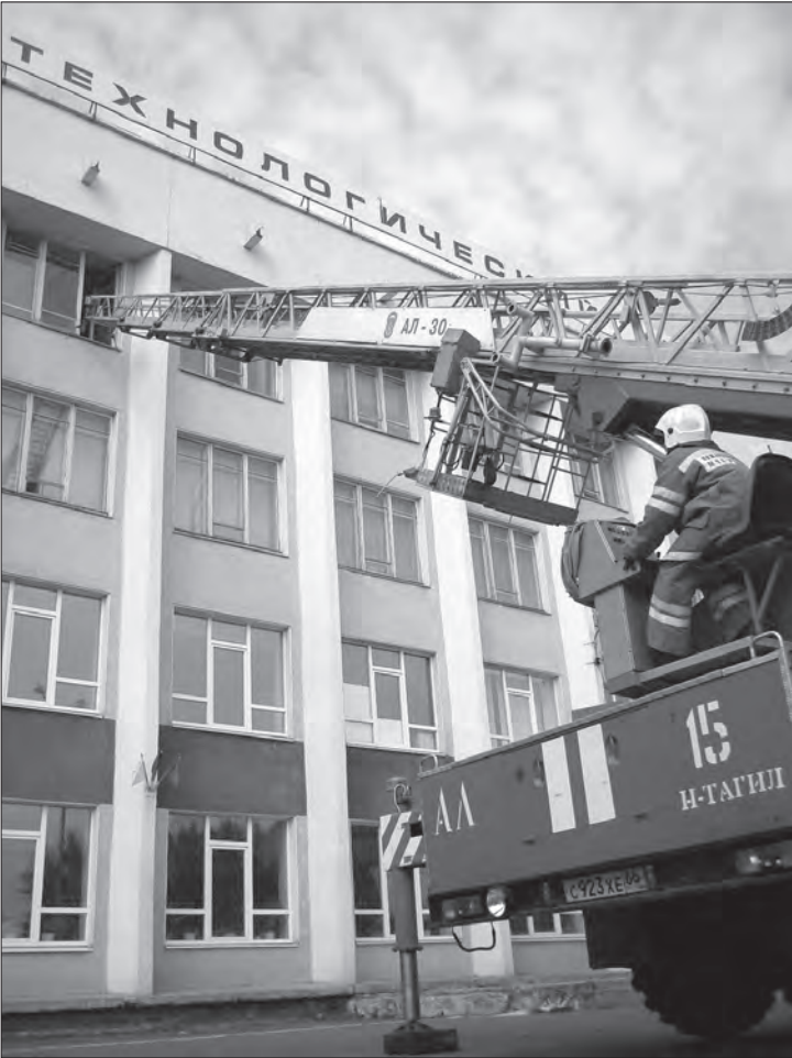
Автолестница – незаменимый помощник пожарных.