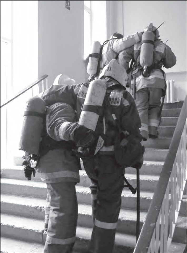
Огнеборцы помогают «раненым» товарищам выйти из здания.