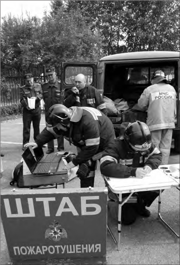
Оперативный штаб пожаротушения был развернут в считанные секунды.

Для поддержания связи его использовали и поисковые службы, когда в прошлом году в лесу заблудились несколько детей из Нижнего Тагила. К автобусу подключается дизельный агрегат, так что, пока горючее не кончится, будет радиосвязь, которая является на сегод-