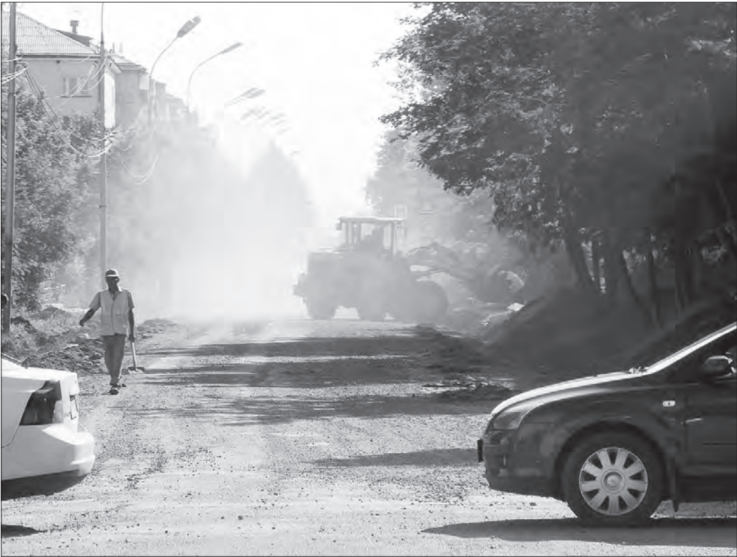
Идет ремонт.