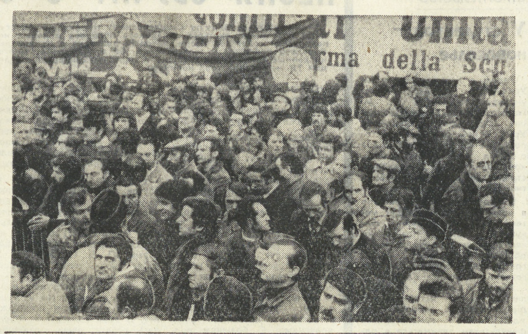
ИТАЛИЯ. Трудящиеся Милана требуют принять меры против свертывания производства и роста безработицы.

«КПСС проводит свой XXV съезд». «Л. И. Брежнев выступает за разрядку». «Москва за всемирный отказ от применения силы».