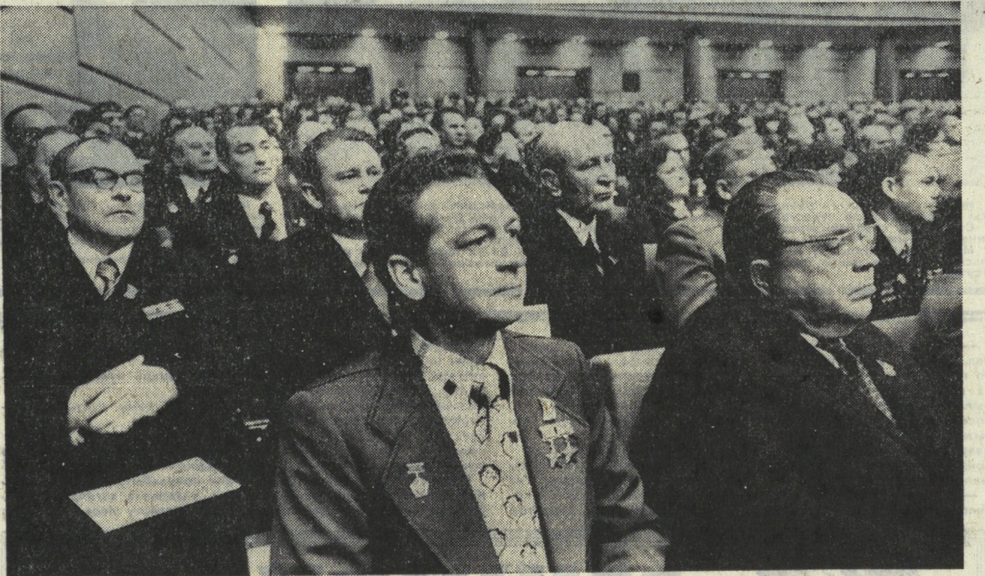
Москва. XXV съезд КПСС. НА СНИМКЕ: в зале заседаний. В центре — дважды Герой Советского Союза, летчик-космонавт СССР В. И. Севастьянов. Фотохроника ТАСС.