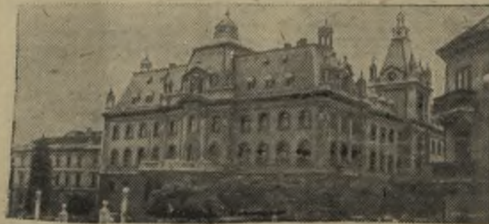
Югославия. Люблянский университет — одно из старейших учебных заведений страны. За годы народной власти значительно увеличилось число его учащихся.