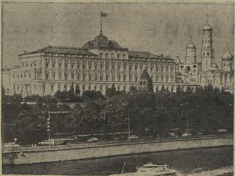
Москва. Большой Кремлевский дворец. 24 ноября 1971 года здесь откроется третья сессия Верховного Совета СССР восьмого созыва.