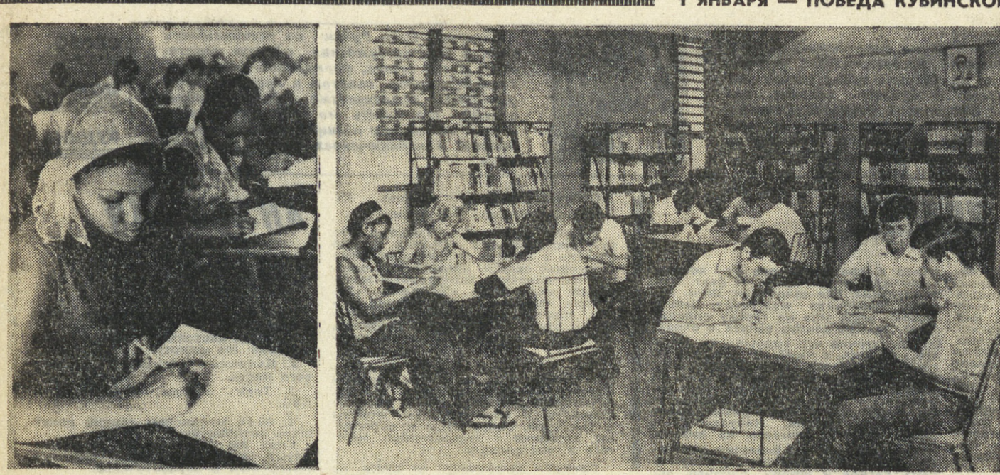
Куба — перал и единственная страна Латинской Америки, покончившая с неграмотностью. Ее называют «страной-школой» и не без основания: здесь учится каждый третий. В настоящее время среднее и высшее образование получают окладно около трех миллионов человек. В стране успешно решается задача подготовки квалифицированных кадров для народного хозяйства. На снимках: учащиеся средней сельскохозяйственной школы имени Рубена Мартинеса Вильены в Гаване — на уроке и в учебном кабинете.