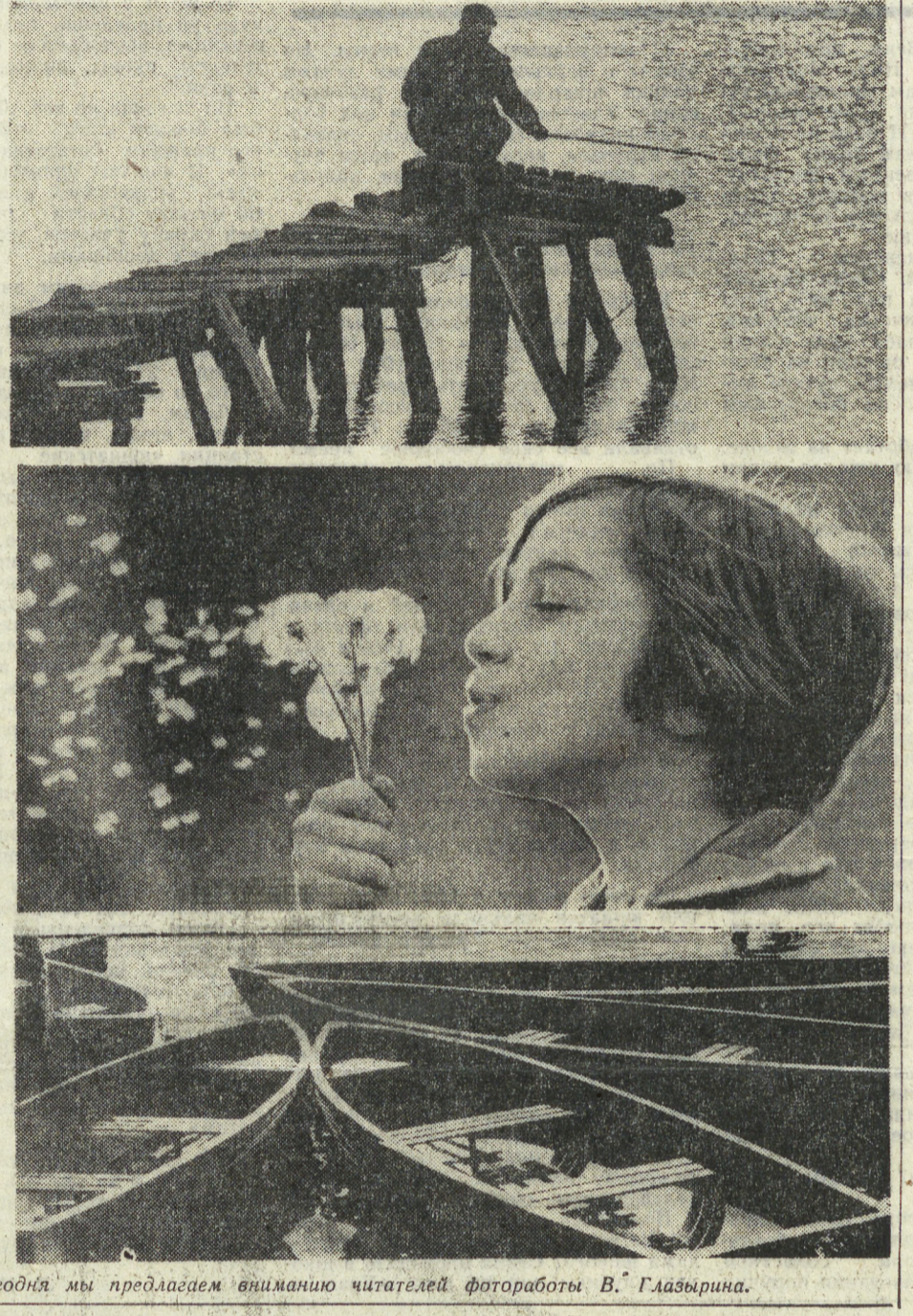
Сегодня мы предлагаем вниманию читателей фотоработы В. Глазырина.